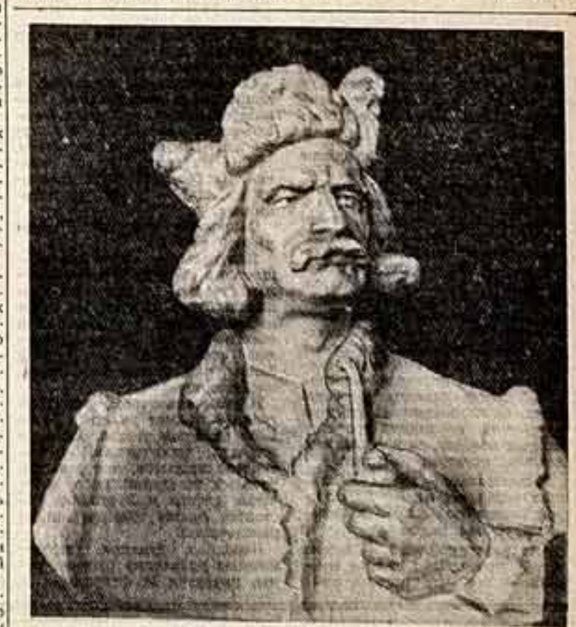
В. Борисенко. «Хозяин Вихоринки». Всесоюзная юбилейная художественная выставка.

В Москве в Центральном доме Советской Армии имени М. В. Фрунзе открылась фотовыставка в честь 40-й годовщины Вооруженных Сил СССР. Многочисленные фотографии рассказывают о боевой и политической учебе воинов, их повседневной жизни и культурном отдыхе. На отдельных фотоснимках запечатлены летчики, штурманы и авиатехники, изучающие материалы авиационного Планами ВВС СССР.