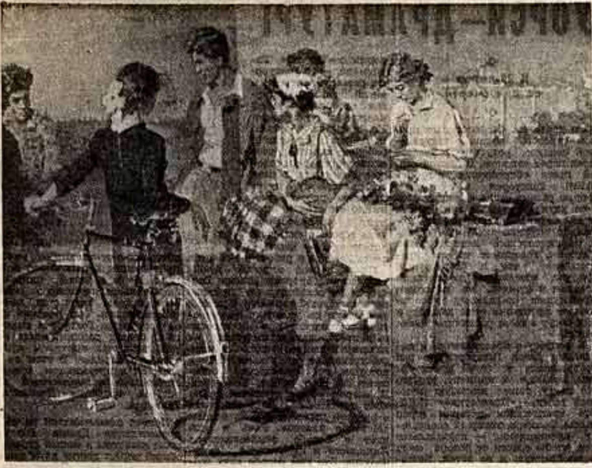
Г. Савинов. «Университетская набережная». Всесоюзная юбилейная художественная выставка.