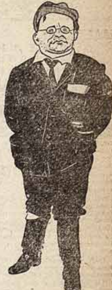
Менюцкий - Моргунец (Время, вперед!)