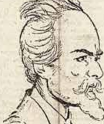
Рис. Б. Владимиров