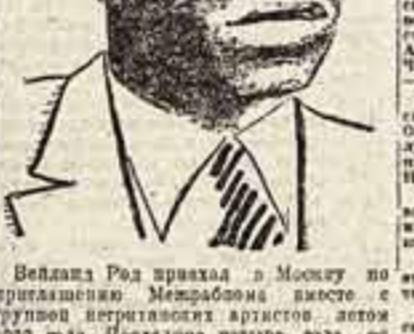
Рис. А. Шахова