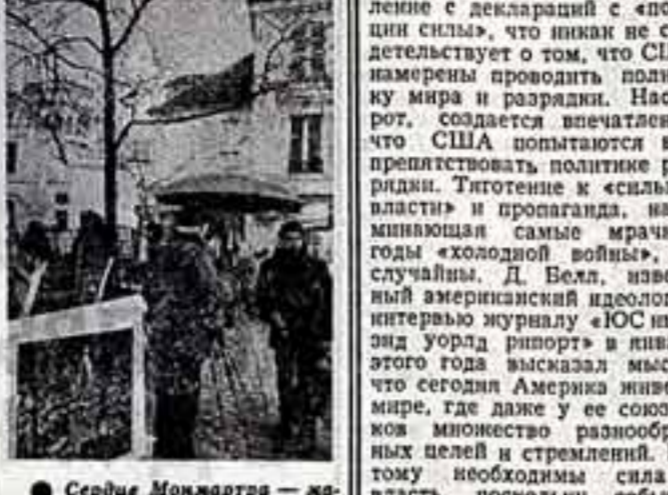
Сердце Монмартра — маленькая площадь, излюбленное место художников.