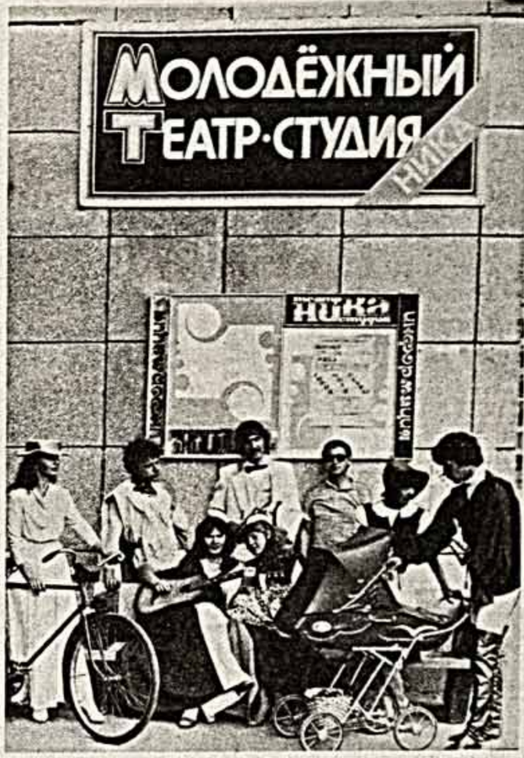
Н. Пархоменко. «Ника» образца 1983 года.

И создать «Ника» и сам он для «Ники» — не просто человек, который не только выставляет картины, но и организует выставки.