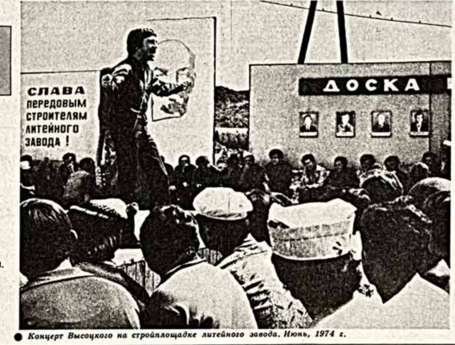
Концерт Высоцкого на стройплощадке литейного завода. Июнь, 1974 г.

Этой, комсомольцы, молодозелено! Нам эта стройка доверена! Самая крупная, самая важная! Вперед, неотступная братва отважная! Гудеть КАМАЗу — городу быть! Давайте разом мечту творить!