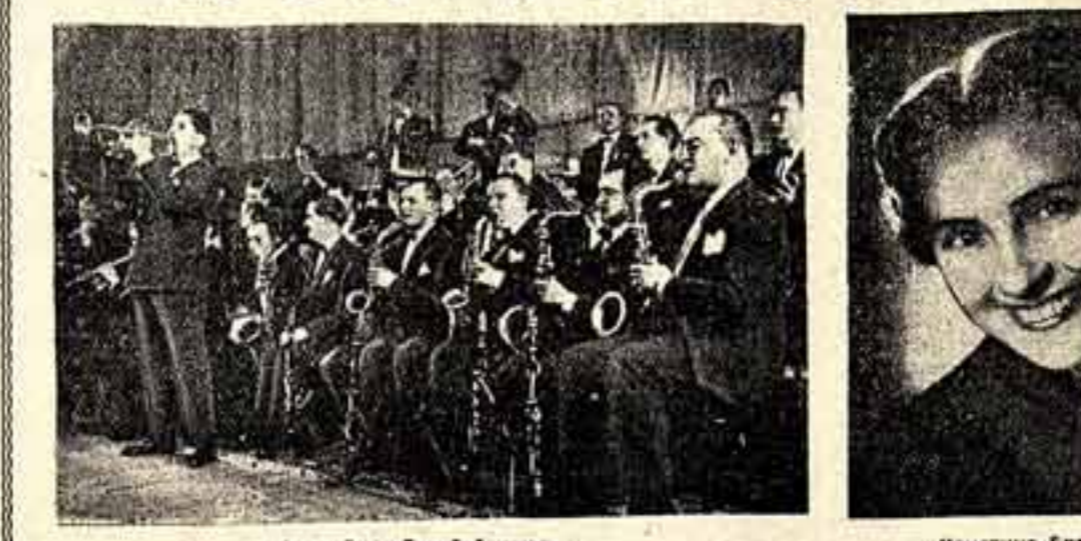
Ансамбль «Голубой джаз».

Из Варшавы в Москву по приглашению Министерства культуры СССР 30 июня приезжает Польский музыкальный ансамбль «Голубой джаз». В ансамбле 43