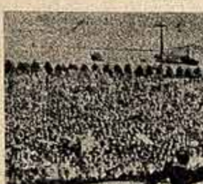
Баку. Фестиваль молодежи Азербайджанской ССР. На снимке: выступление коллектива Нухинского двора культуры на площади имени Сталина.

городских, областных и районных конкурсов. Приехали и гости — делегации братских республик. Приморская площадь у Дома правительства звенит молодыми голосами, звучат песни, смех, шутки; слышен шум воздушных шаров с девизом «За труд и счастье». Высоко над домами парит подбитый аэропланом огромный портрет Владимира Ильича Ленина. Вместе с руководителями правительства и компартии Азербайджана на трибуну поднимаются вице-президент Индия Радхакриш-