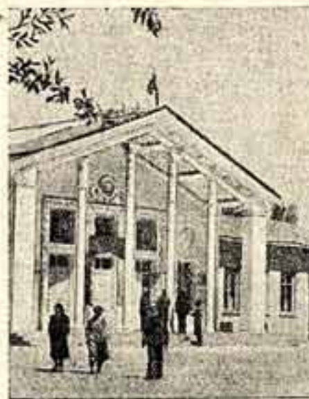
На снимке: здание нового клуба.

Узбекская ССР. Недавно в колхозе «Ленинабад» Ак-Курганского района Ташкентской области открыт новый клуб. Зрительный зал его вмещает 600 человек. Здесь имеются также библиотека, читальный зал, комнаты для занятий кружков художественной самодеятельности.