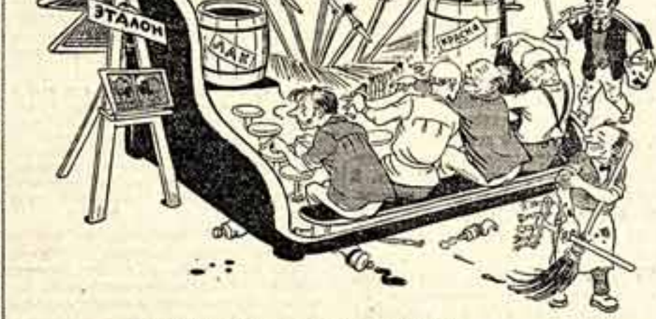
ЖИВПишущая машинка системы «Худфонд».

Новая картина попадает на копирование не скоро, многие хорошие старые картины советских художников остаются еще «в обиходе». Классическая живопись Запаदा вообще в массовую копию никогда не шла, хотя в музеях нашей страны имеются прекрасные произведения живописи.