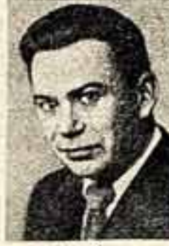
М. М. Янин

Один из выдающихся представителей второго поколения актеров Московского Художественного академического театра имени М. Горького, народный артист СССР М. М. Янин работает в МХАТ 33 года. Уже в первых спектаклях он обнаружил большое, разностороннее дарование. Вся последующая творческая деятельность принесла М. М. Янину широкую популярность. За годы своей плодотворной сценической жизни актер создал обширную галерею ярких, запоминающихся образов. В их числе Паросик («Дядя Турбины»), Антоин и Бартоло («Безумный день или Женитьба Фигаро»), Вась («Кавалеры круга»), Бублик («Платон Кречет»), Сергей Горюнов («Фронт»), Харитонов («Русские люди»), Ферлант («Три сестры»), Маргаритов («Подлая любовь»), Двоечник («Дачники») и многие другие. Советскому зрителю М. М. Янин хорошо знаком и как талантливого артиста кино. Наряду с артистической деятельностью М. М. Янин ведет большую режиссерскую работу. В качестве режиссера он принимал участие в ряде постановок МХАТ: «Хозяйка гостиницы», «Фронт», «Подлая любовь», «Илья Голынов». В течение нескольких лет Михаил Михайлович — главный режиссер Московского драматического театра имени К. С. Станиславского.