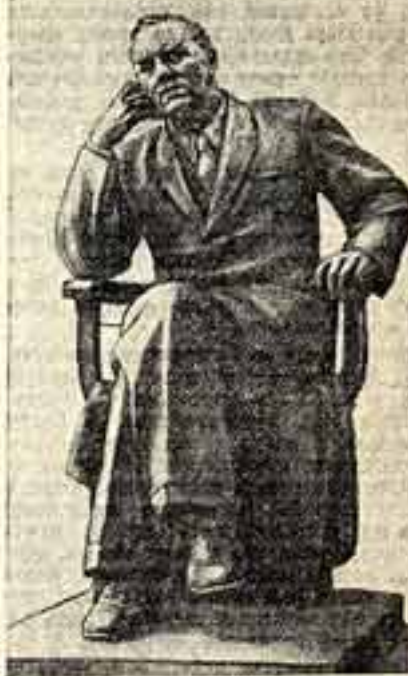
«К. А. Тренев». Скульптор Е. Везинов.

Драматургическое наследие Константина Андреевича Тренева неслучайно во всю свою жизнь он написал немногим более десяти пьес, из них в репертуар вошло пока только четыре. Но именно эти четыре произведения составили целую эпоху в истории советского искусства, без них невозможно представить творческую биографию советских театров, они были и всегда останутся полновидной школой мастерства для советских актеров.