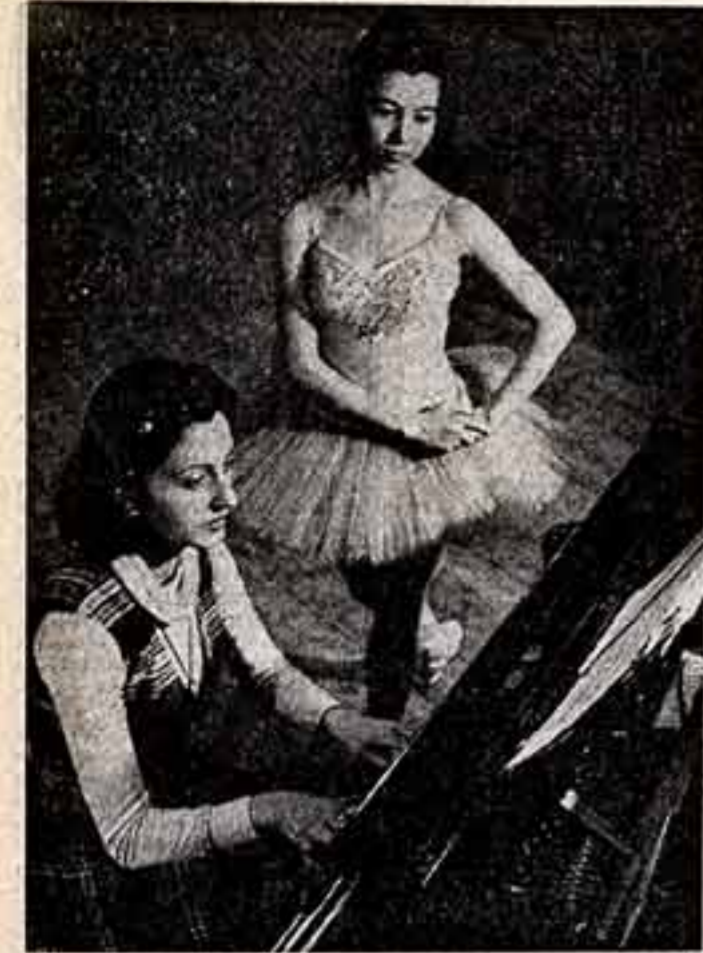
Танцевальное искусство Армении имеет многовековую историю. Самобытно оно отразило богатый духовный мир армянского народа...