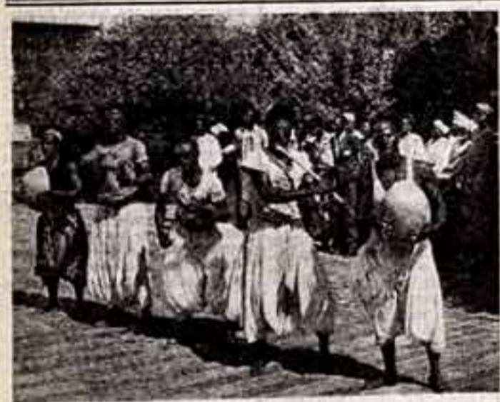
Африканские танцы — это большое и сложное искусство...