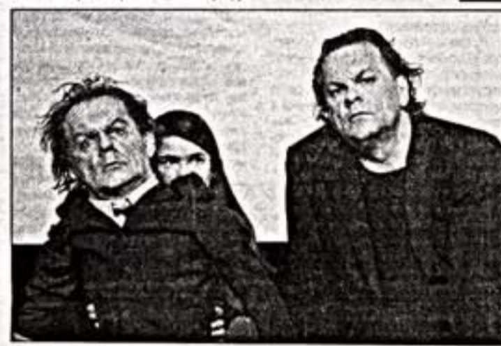
Сцена из спектакля "Бассариды"

По контрасту портретов "Бассариды" живого классика Ханса Вернера Хенце - сильнейшая вариация на тему последней трагедии Еврипида "Вознесение".