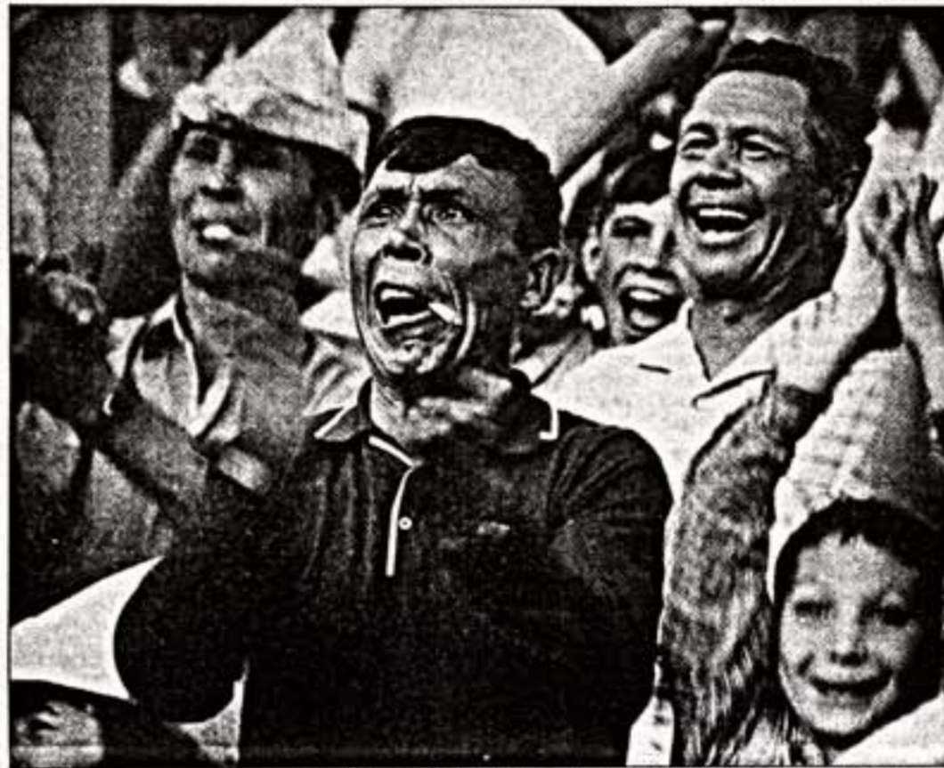
"Го-о-о-о!" Бельгийка "Спартак", Москва, "Лужники", 1962 г.