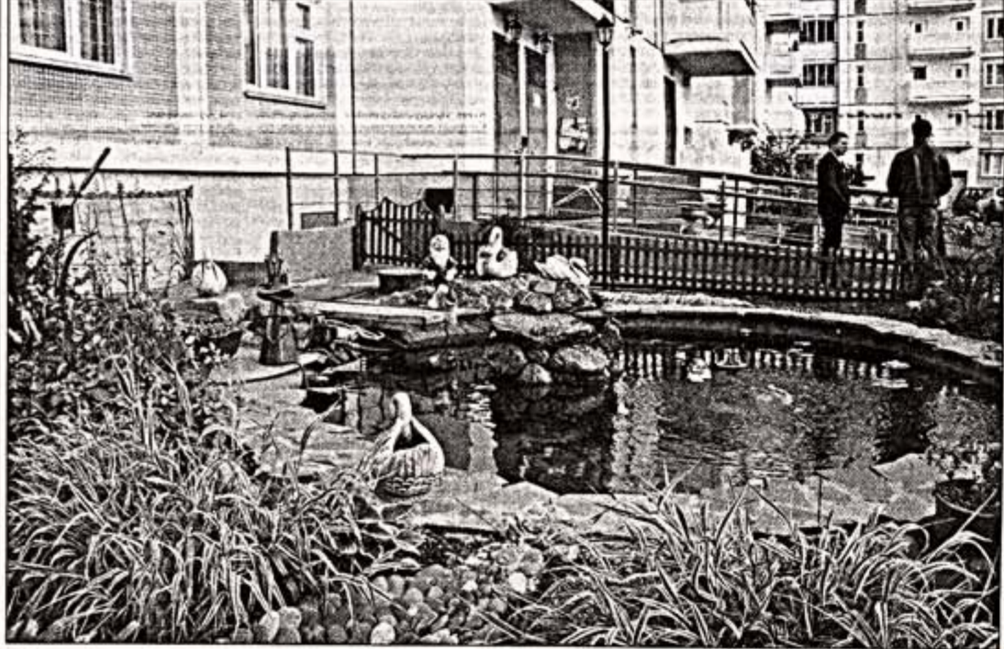
Мы удались под сень дворовых ступей...