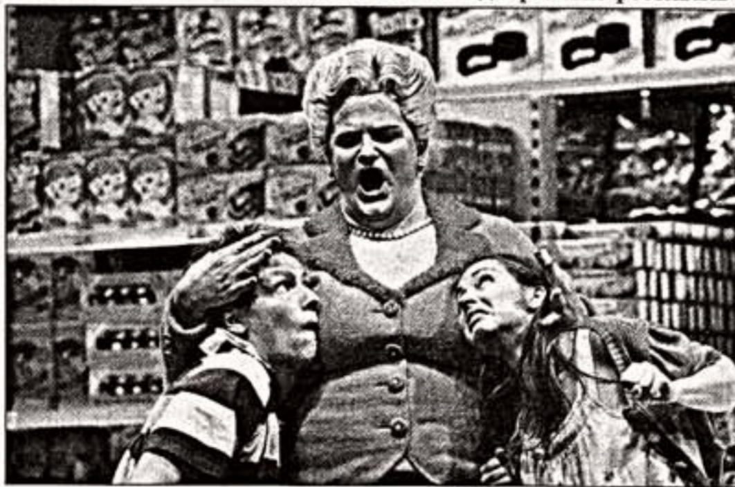
Сцена из спектакля "Генет и Гретель"

В середине августа меломаны всего мира бросились в Англию в Глайндборн на театральную оперу премьеру этой лета - "Любовь и другие демоны".