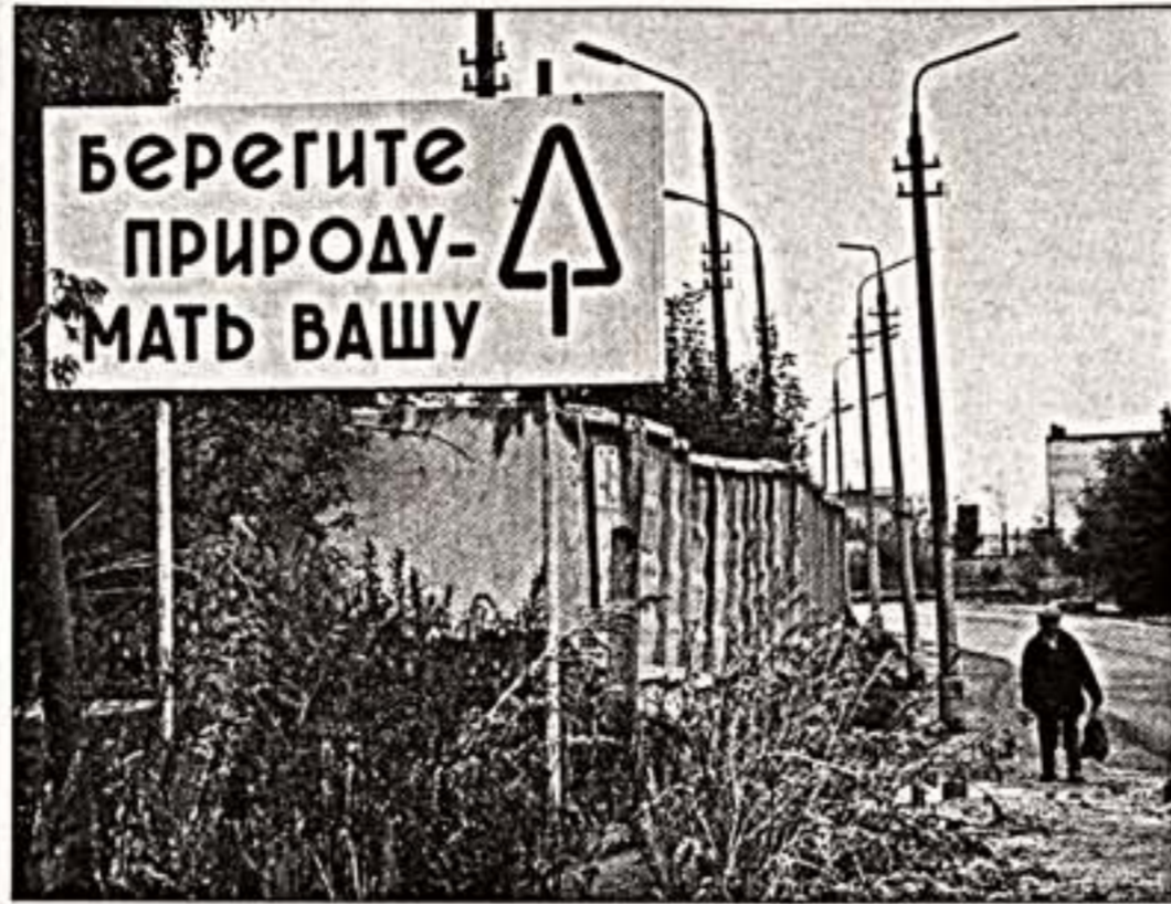
"Подмосковье", 1985 г.