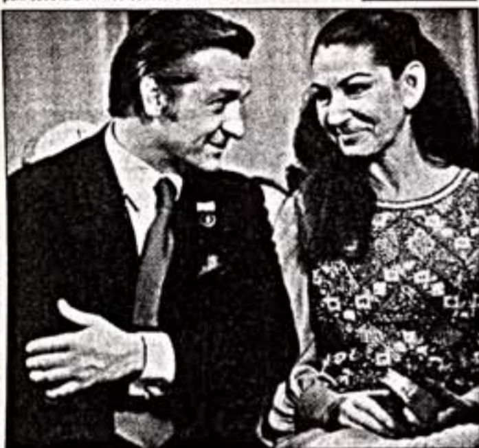
Валерий Кимов и Мария Каллас. Большой зал консерватории, Москва, 1970 г.