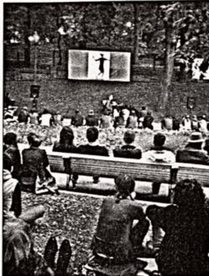
Слева: выставка "Рирагаззо" Р.Бариллари в Столешниковом переулке. В центре: фестиваль "ПУСТО". Справа: "Подводный мир" Д.Дубиле на Чистых прудах