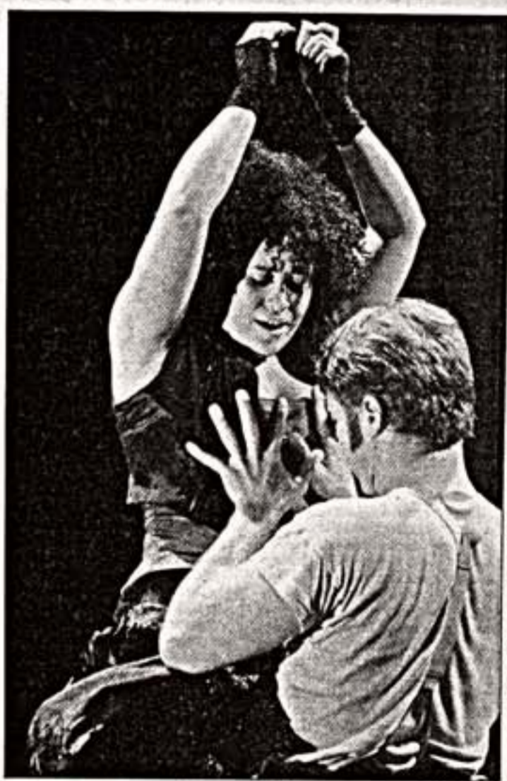
Сцена из спектакля "Кармен"

Возвращение Марии Браун - это не просто возвращение к фильму Фассбиндера, это возвращение к его философии.