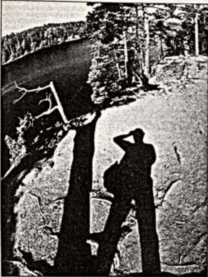
"Валаам", 1984 г.