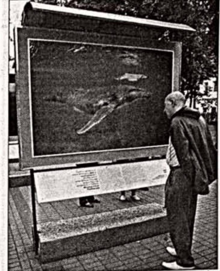
Слева: выставка "Рирагаззо" Р.Бариллари в Столешниковом переулке. В центре: фестиваль "ПУСТО". Справа: "Подводный мир" Д.Дубиле на Чистых прудах

Встречи в "Академии" В Омске 6 сентября стартует I Международный театральный фестиваль "Академия", в котором примут участие 12 лучших творческих коллективов Европы. Свои работы покажут Белградский национальный театр (Сербия), драматический театр "Берлинер ансамбль" (Германия), театр "Креда" (Болгария), Государственный малый театр из Вильнюса (Литва).