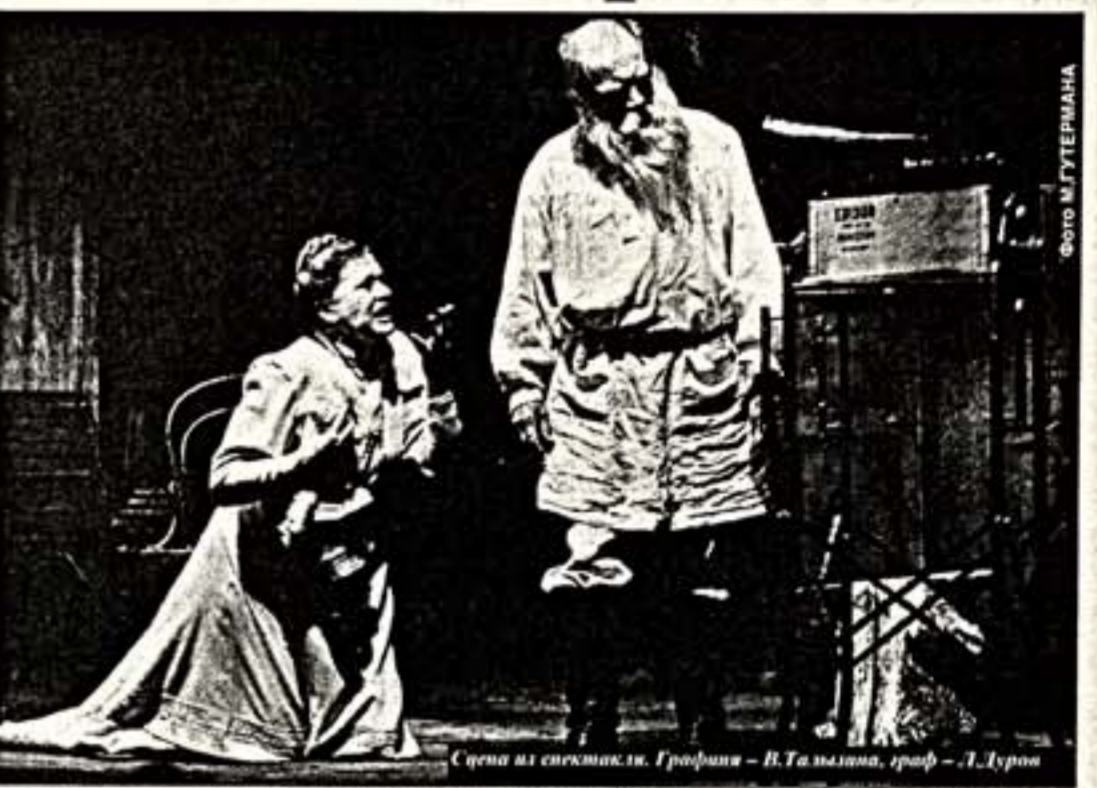
Сцена из спектакля "Графиня" в Театре им. Г. Диброва