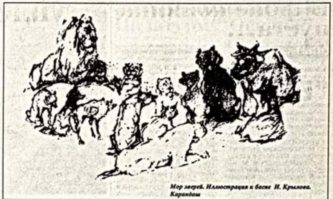
Мор зверей. Иллюстрация к басне И. Крылова. Карандаш