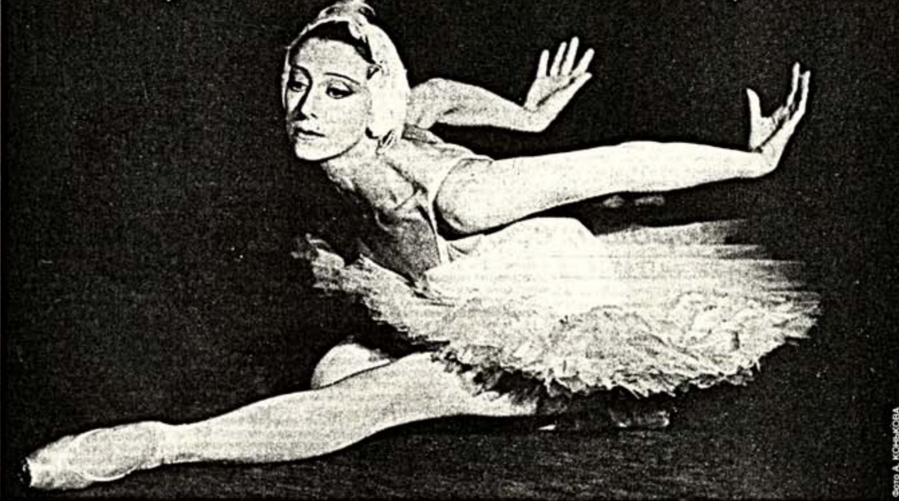
20 ноября — день рождения Майи Плисецкой. 28-го она отмечает его на сцене Большого театра. Мы посвящаем великой балерине свою 12-ю страницу.