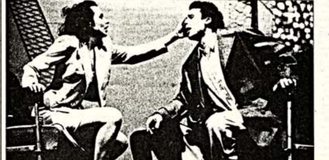
Сцена из спектакля "Пороховая бочка"

При полном отсутствии того, что мы привыкли называть "политическим театром", БИТЕФ не пытался представлять неким "абстрактно-гуманистическим" организм, парящим над котлом балканских раздоров. Наоборот. Были серьезные попытки не только показать, к чему ведут культ агрессивности, неумение считаться с законами, по которым живет весь остальной мир, и элементарную бескультурность, но и проанализировать национальную психологию, взгляд на продвижение, взгляд на идею превосходства над соседями и самозолотия заводят в тулук, а насилие может породить лишь ответное насилие, распространяющееся со скоростью цепной реакции.