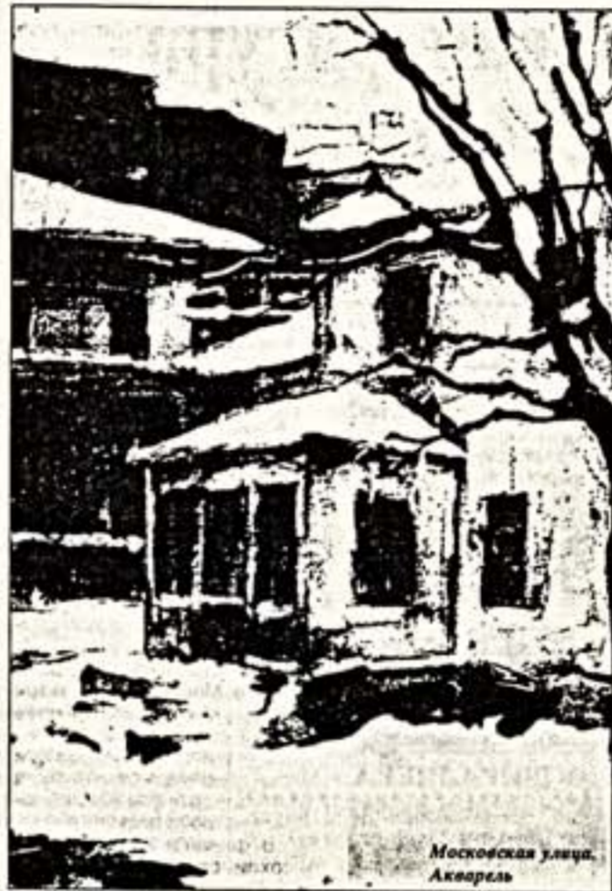
Московская улица. Акварель