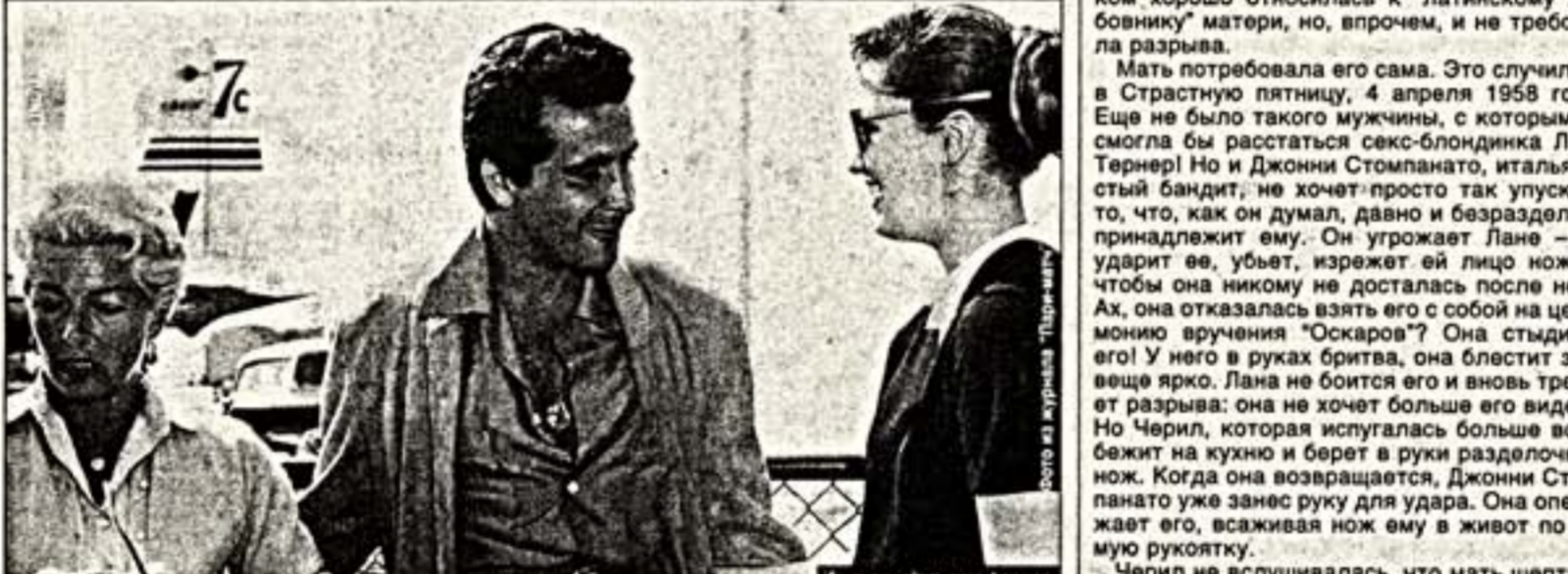
То притворилась глухой