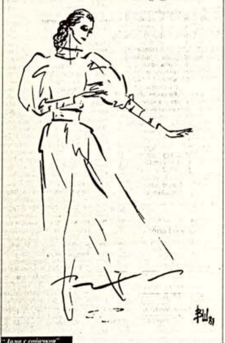
"Дама с собачкой"

Рисунки Владислава Шахматера — художника, оформившего книгу "Я, Майя Плисецкая..."