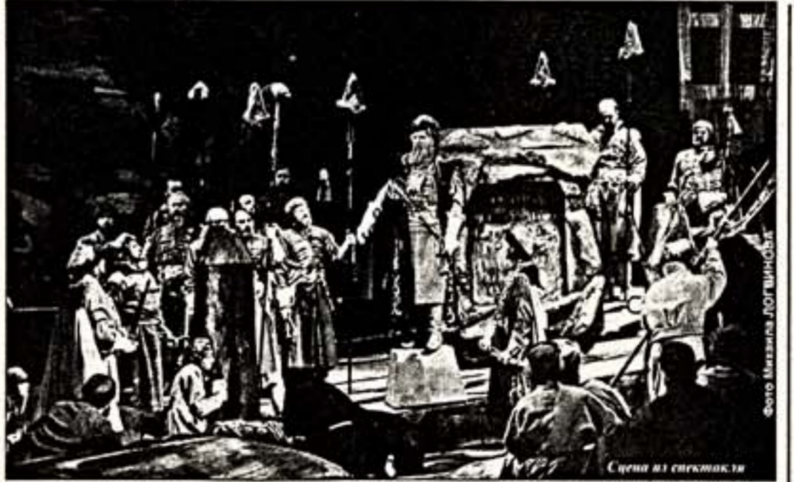
Сцена из спектакля "Хованщина" в Большом театре