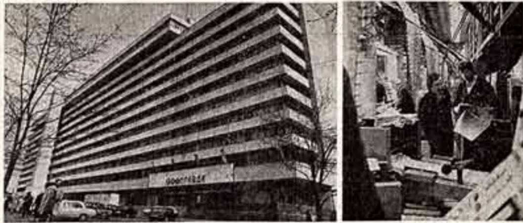
Новое здание «Правды». Печатается газета.

со стороны, пассивно, равнодушно, но можно писать историю по-другому. Ленин требовал от журналистов, требовал от правдолюбцев, активного вмешательства в жизнь. Ленин требовал от журналистов партийности, классового подхода и политическим, активным вмешательством в жизнь. Ленин требовал от журналистов партийности, классового подхода и политическим, активным вмешательством в жизнь. Ленин требовал от журналистов партийности, классового подхода и политическим, активным вмешательством в жизнь.