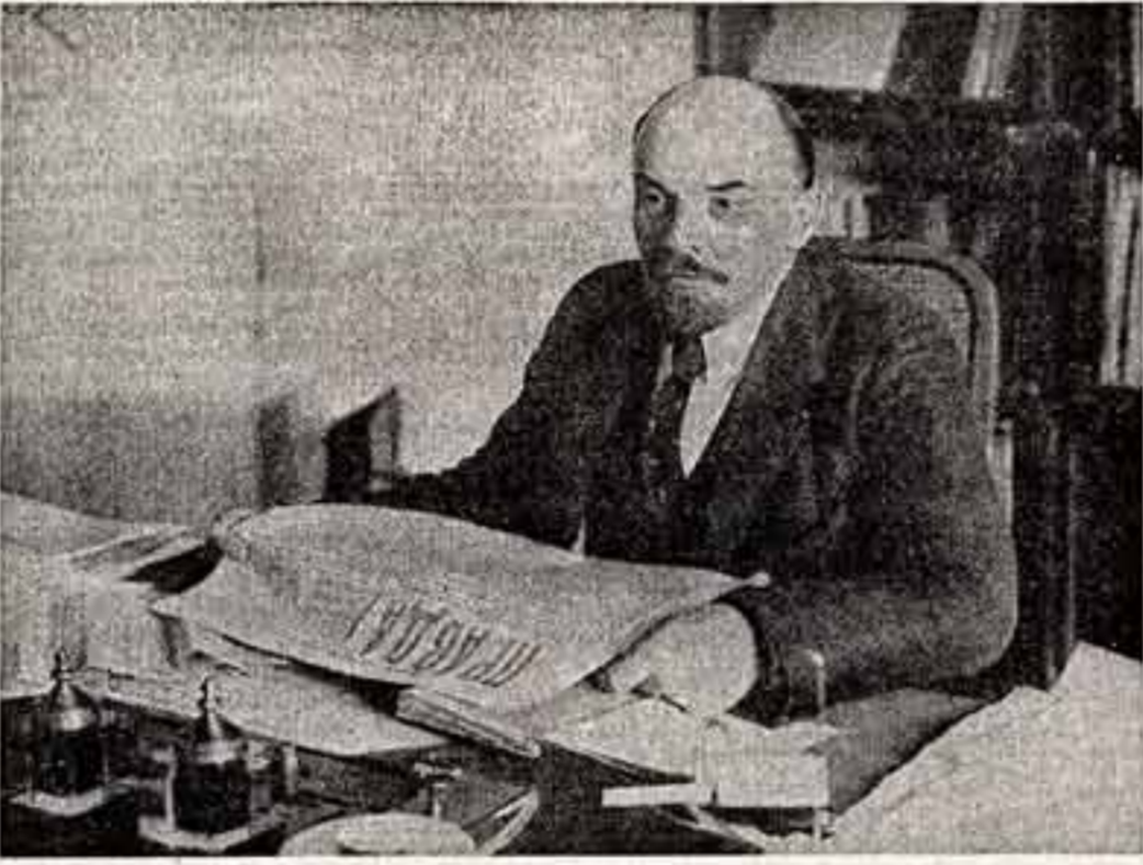
В. И. Ленин за рабочим столом в своей комнате в Кремле. 1918 год.

Очередной смотр сил и резервов советской прессы проходит в преддверии великого праздника народов нашей многонациональной Родины — 60-летия образования СССР. Показывая огромные успехи Страны Советов, достигнутые благодаря осуществлению ленинской национальной политики партии, широко осмеляя соревнование за достойную встречу юбилея, пресса вносит весомый вклад в укрепление братского единства советских народов, воспитание людей в духе патриотизма и социалистического интернационализма, дальнейшего сплочения народа вокруг Коммунистической партии, ее ленинского Центрального Комитета.