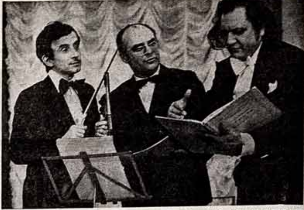
Немало интересного, полезного по линии культурно-просветительной работы и организации досуга делает Центральный дом культуры медицинских работников...

Следует сказать, что «Неделя» особенно ценна для таких категорий работающих, которые не имеют возможности часто посещать культурные мероприятия.