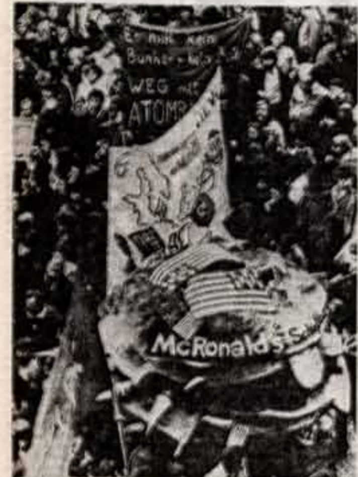
В Барно ищут не только еду, но и место, где можно выразить протест против американского империализма...

С объявлением «Советской культуры» в ТАСС