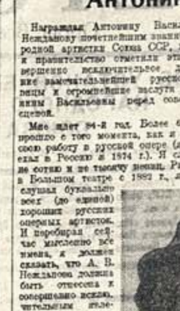
П. К. Саксаганский

Как и большинство моих товарищей, московских оперных артистов, я получила звание Народного артиста Советского Союза.