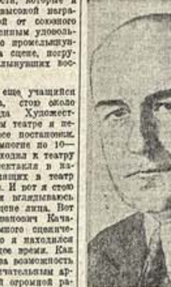
Б. В. Шукин Народный артист Союза ССР

В дни большого творческого подъема и огромной радости, которые я ощущаю в связи с высокой наградой, полученной мной от советского правительства, с особым удовольствием вспоминаю о прожитых годах работы на сцене, которую я глупо называю своим искусством.