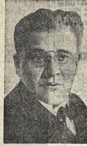
И. М. Москвин Народный артист Союза ССР

Известие о присвоении мне высокого звания Народного артиста Союза ССР заставило меня во время воспоминаний вернуться к своим корням. Я отдал в Чебоксары на курорт в два месяца артиста под Бурлачино. Когда я возвращался из Бурлачино, курорт места восторженной мной высокой награды и ушел от меня парадный мундир и шапка. Когда я вышел из театра в Чебоксары, то в руках у меня были «Правда» и «Известия», где было опубликовано постановление правительства. Я был этим очень доволен. Носивши звание, я работаю, чтобы оправдать это высокое звание. Я работаю, чтобы оправдать это высокое звание. Я работаю, чтобы оправдать это высокое звание.