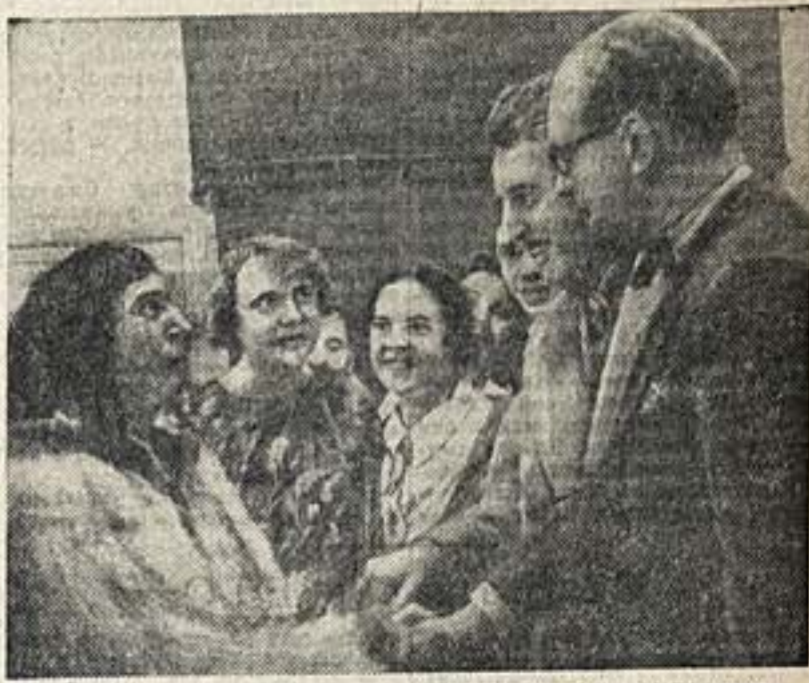
Гости IV советского театрального фестиваля смотрели в московском театре Революции пьесу И. Сельвинского «Умла»...

Брукс Эткинсон Драматург и театровед (США)