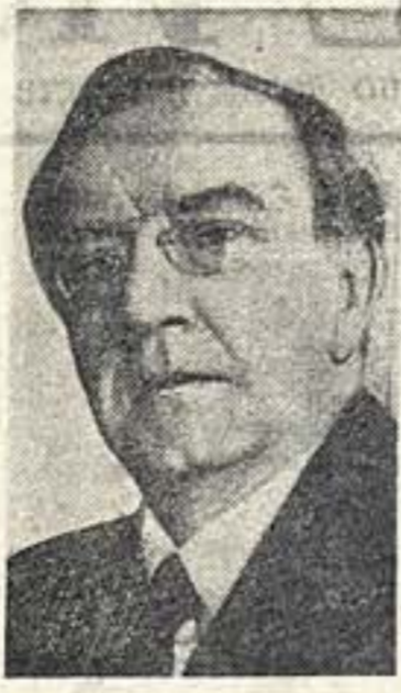
В. И. Качалов

Нет слов, чтобы выразить необычайную, возмущающую радость. Я работаю, чтобы оправдать это высокое звание. Я работаю, чтобы оправдать это высокое звание.