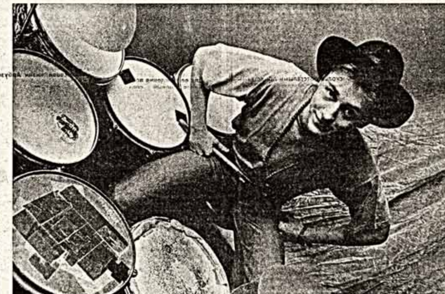
Сергей Безруков в фильме «Ноктюрн для барабана и мотоцикла».