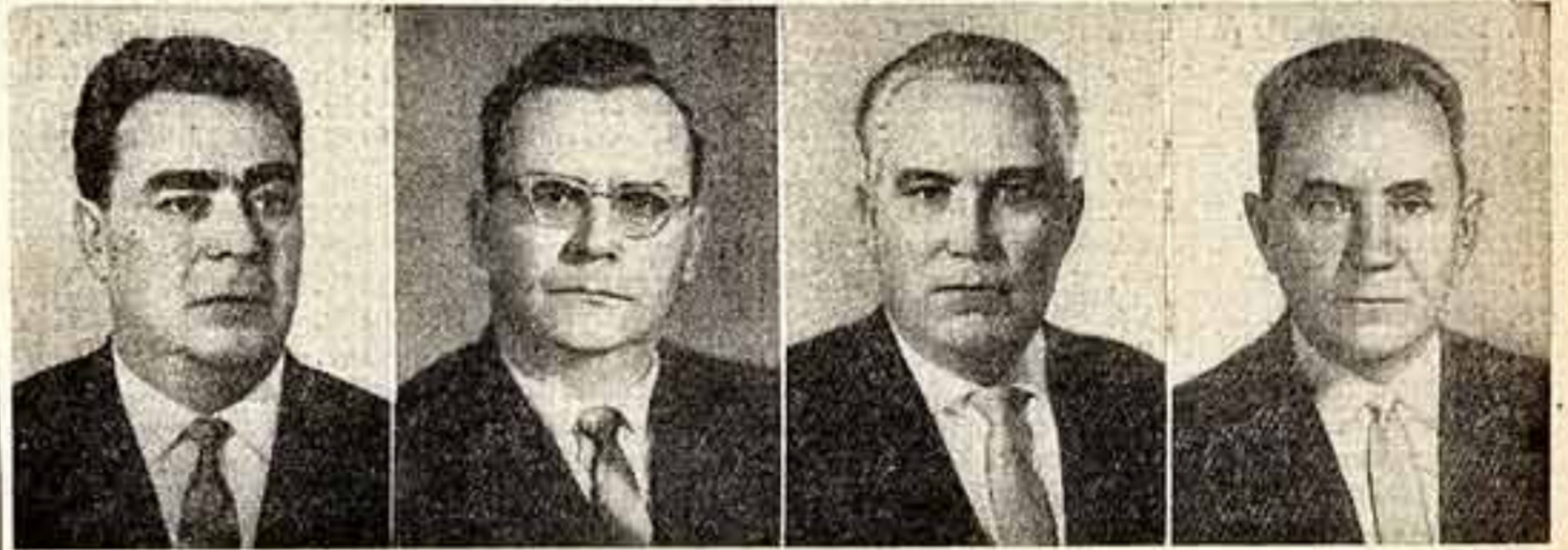
Л. И. Брежнев. Член Президиума ЦК КПСС. Г. И. Воронов. Член Президиума ЦК КПСС. Ф. Р. Козлов. Член Президиума ЦК КПСС, секретарь ЦК КПСС. А. Н. Косыгин. Член Президиума ЦК КПСС.

Центрального Комитета избрал Президиум ЦК, Секретариат ЦК, утвердил Председателя Комитета Партийного Контроля при ЦК КПСС и первого заместителя Председателя Комитета Партийного Контроля. Он сообщает также, что Центральная Революционная Комиссия избрала Председателя Комиссии. Президиум ЦК утвердил Бюро ЦК по РСФСР. После докладов Комиссий были единогласно приняты Резолюция XII съезда по Отчету Центрального Комитета КПСС, Программа КПСС и Устав КПСС. С краткой заключительной речью выступает товарищ Н. С. Хрущев. Он объявляет XII съезд Коммунистической партии Советского Союза закрытым. Делегаты и гости с большими воодушевлением исполняют партийный гимн «Интернационал».