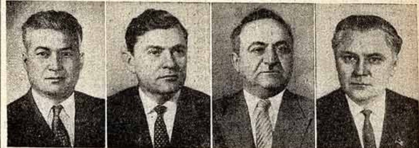
Ш. Р. Рашидов. Кандидат в члены Президиума ЦК КПСС. К. Т. Мазуров. Кандидат в члены Президиума ЦК КПСС. В. П. Мжаванадзе. Кандидат в члены Президиума ЦК КПСС. В. В. Щербицкий. Кандидат в члены Президиума ЦК КПСС.