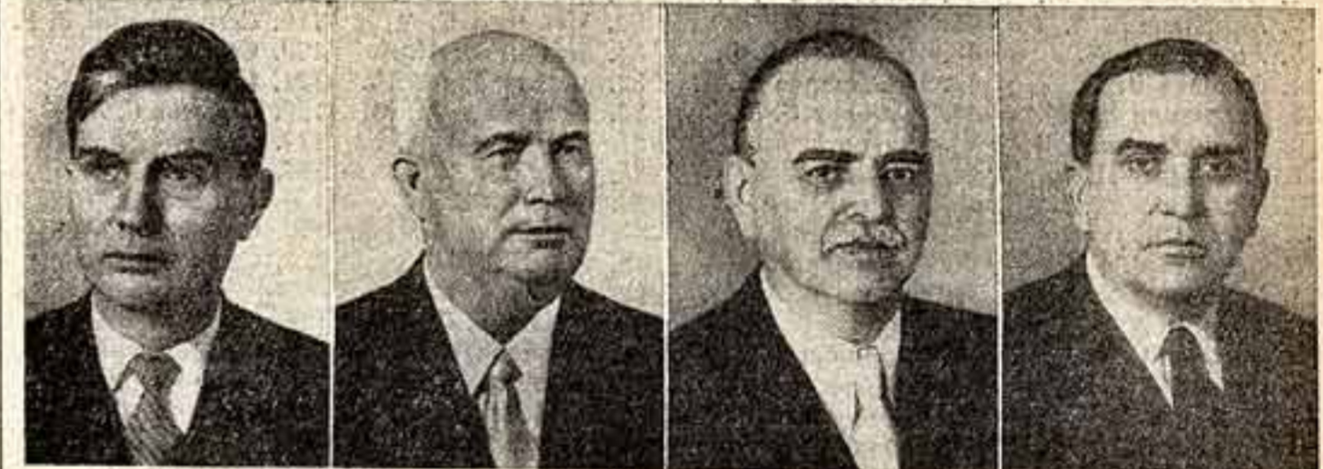
М. А. Сулов. Член Президиума ЦК КПСС, секретарь ЦК КПСС. Н. С. Хрущев. Член Президиума ЦК КПСС, Первый секретарь ЦК КПСС. Н. М. Шверник. Член Президиума ЦК КПСС. В. В. Гришин. Кандидат в члены Президиума ЦК КПСС.