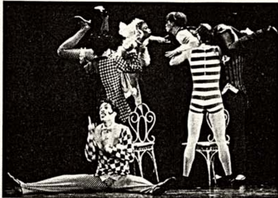
Сцена из спектакля "Клоп"