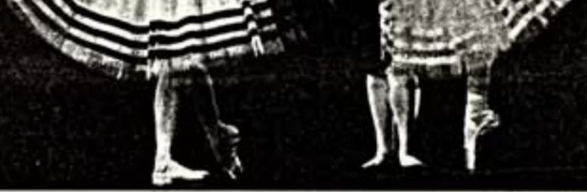
Сцена из спектакля "Неапол"