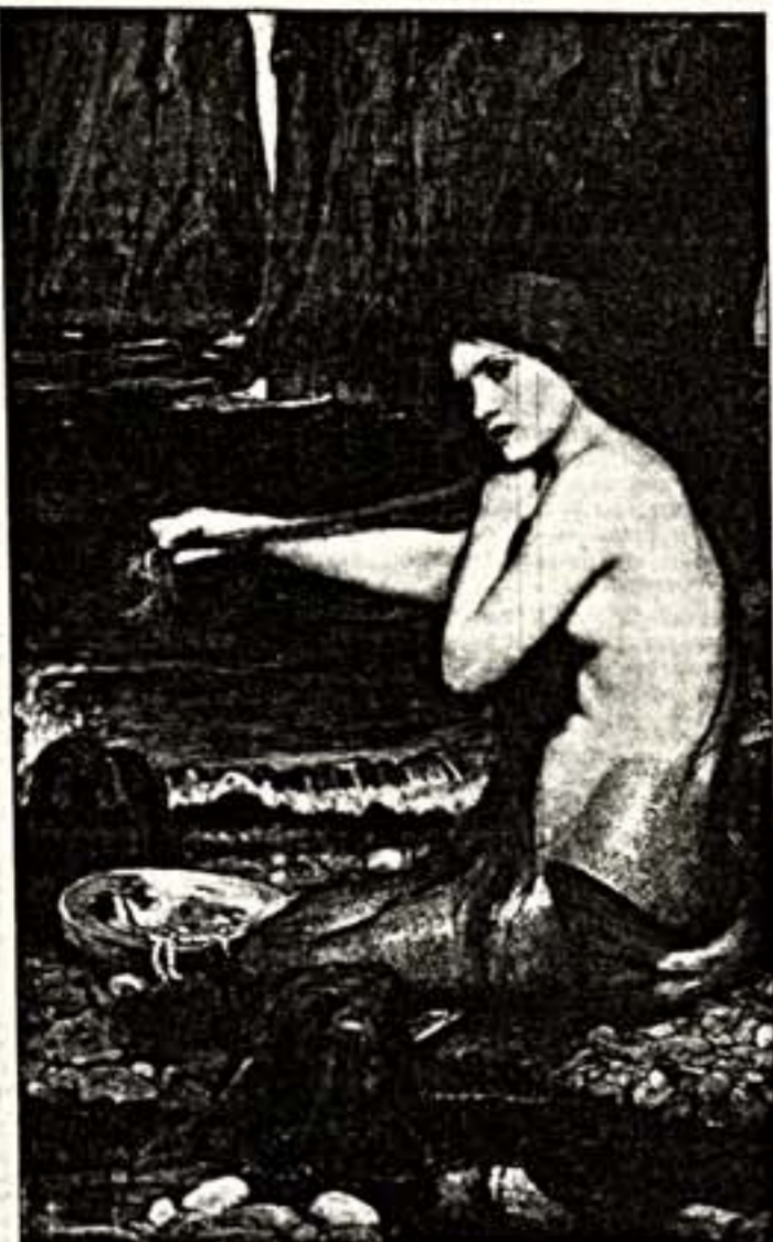
У. Уотерхаус. "Русалка", 1900 г.