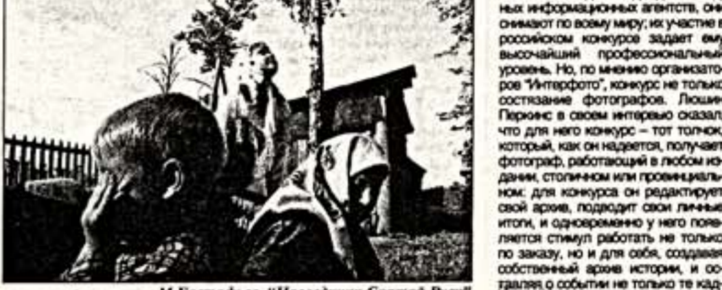
М.Евстафьев. "Наследники Святой Руси"

естественно для нашего времени, но, увы, ощущает творческий поиск до сведения требование только современного дня. Современная ситуация с фотографией в нашей стране такова, что отсутствие фотографического образования делает модный журнал учебником фотографа, в экономическом положении