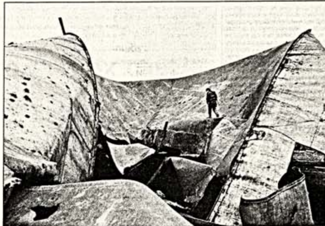
Ю.Козырев. "Воина в Чечне"

Время, когда фотографии превращались в документ, утративший в представлении зрителей свою художественную ценность. Выставка молодых фотографов, как всегда, притягивала к себе внимание уже самим названием. Но, к сожалению, единственное, чем удивила выставка, - это полное отсутствие неожиданностей, как в покое тем или новых сюжетов, так и в проявлении прямой художественной индивидуальности в их воплощении. Во многих снимках ощущалось возмущение рекламной фотографии и стилистикой модных журналов, что