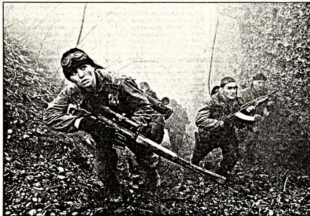
П.Герасимов. "Чечня. Горный рейд морехов"