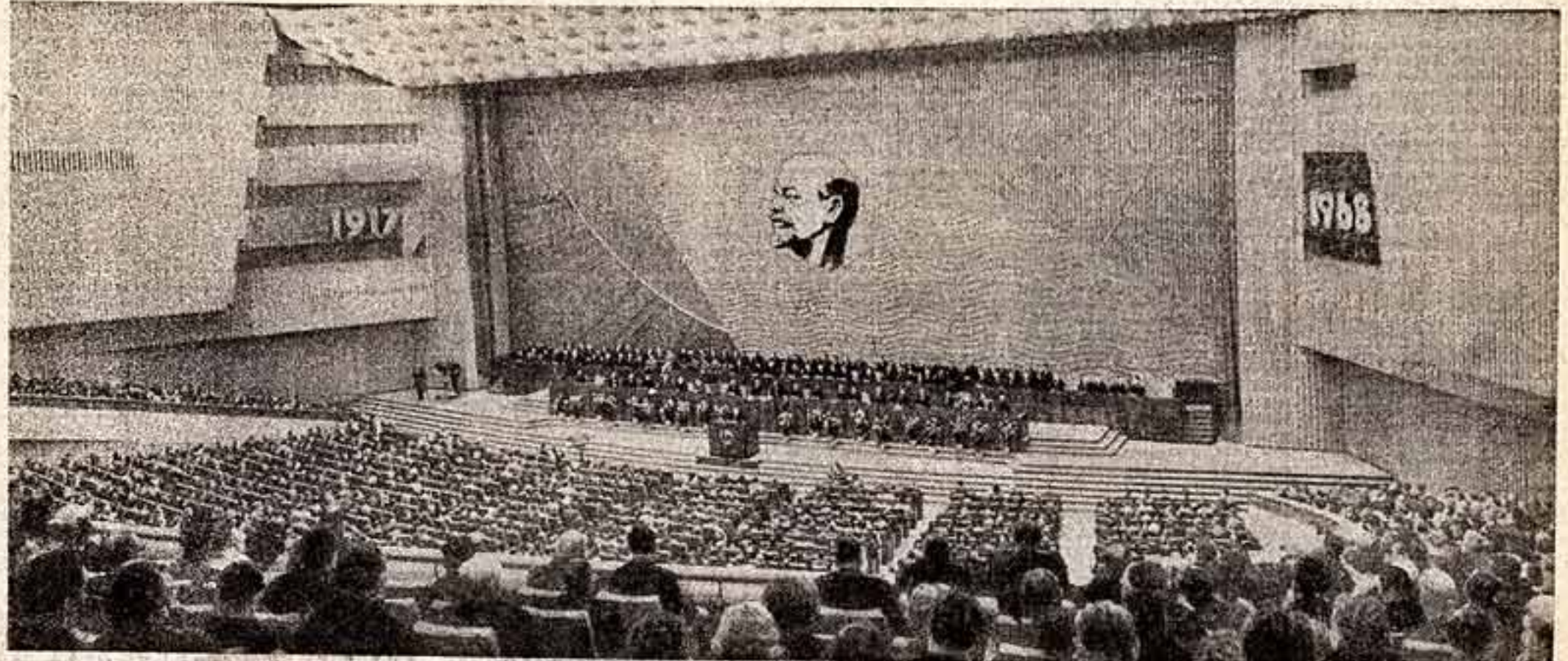
Торжественное заседание в Кремлевском Дворце съездов 6 ноября 1968 г.

Год, открывший второе пятидесятилетие Советской власти, стал новым шагом вперед по пути создания материально-технической базы коммунизма, дальнейшего подъема производства, культуры и жизненного уровня советских людей. Совершенствуя и развивая научные методы руководства народным хозяйством, партия направляет творческую инициативу и энергию масс на всемерное повышение эффективности общественного производства, наиболее полное раскрытие и использование преимуществ и возможностей социалистической системы. Самоотверженный труд рабочих, крестьян и советской интеллигенции успешно претворяется в жизнь решения XXIII съезда нашей партии.