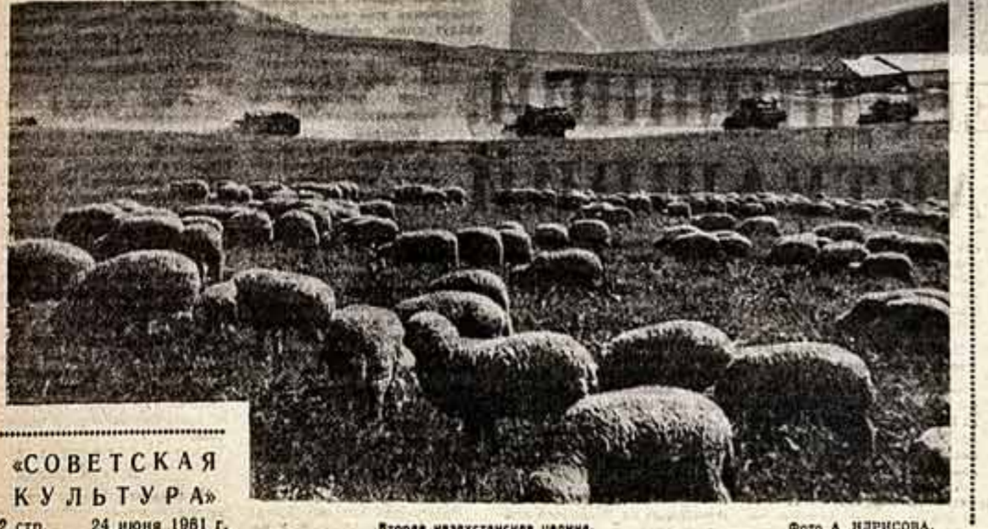
«СОВЕТСКАЯ КУЛЬТУРА» 2 стр. 24 июня 1961 г. Вторая казахстанская целина.