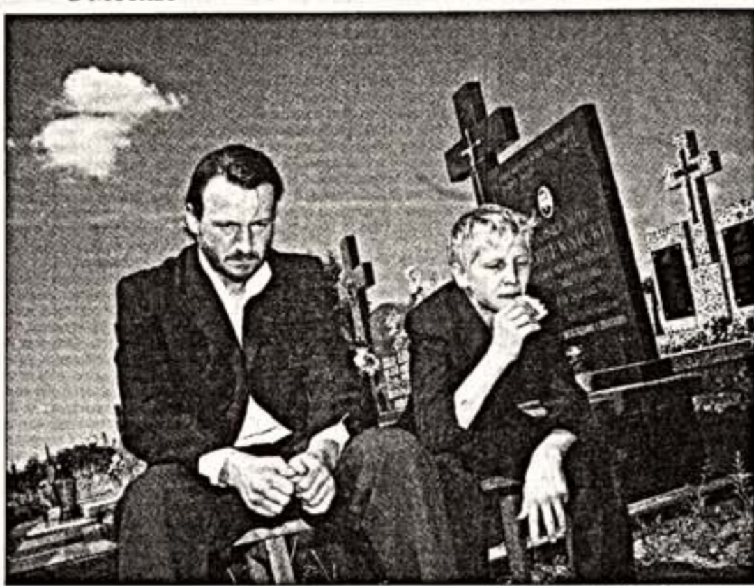
Кадр из фильма "Все будет хорошо"