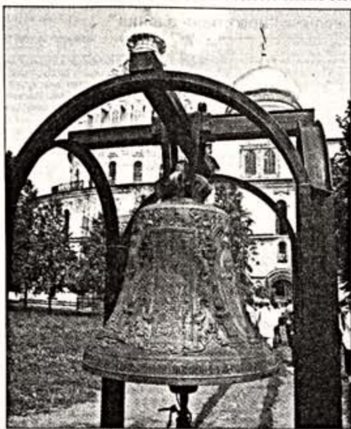
Старинный колокол: предмет культа или культурное наследие?

Проект нового закона "О передаче религиозным организациям имущества религиозного назначения, находящегося в государственной и муниципальной собственности..."