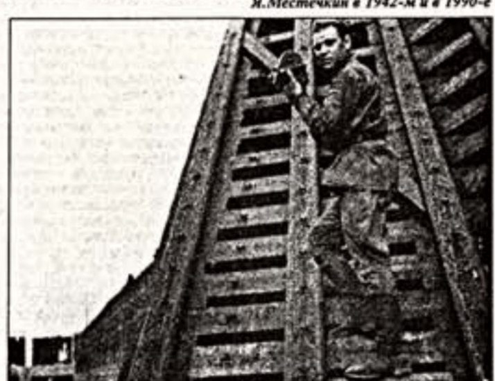
На строительстве канала (1943)