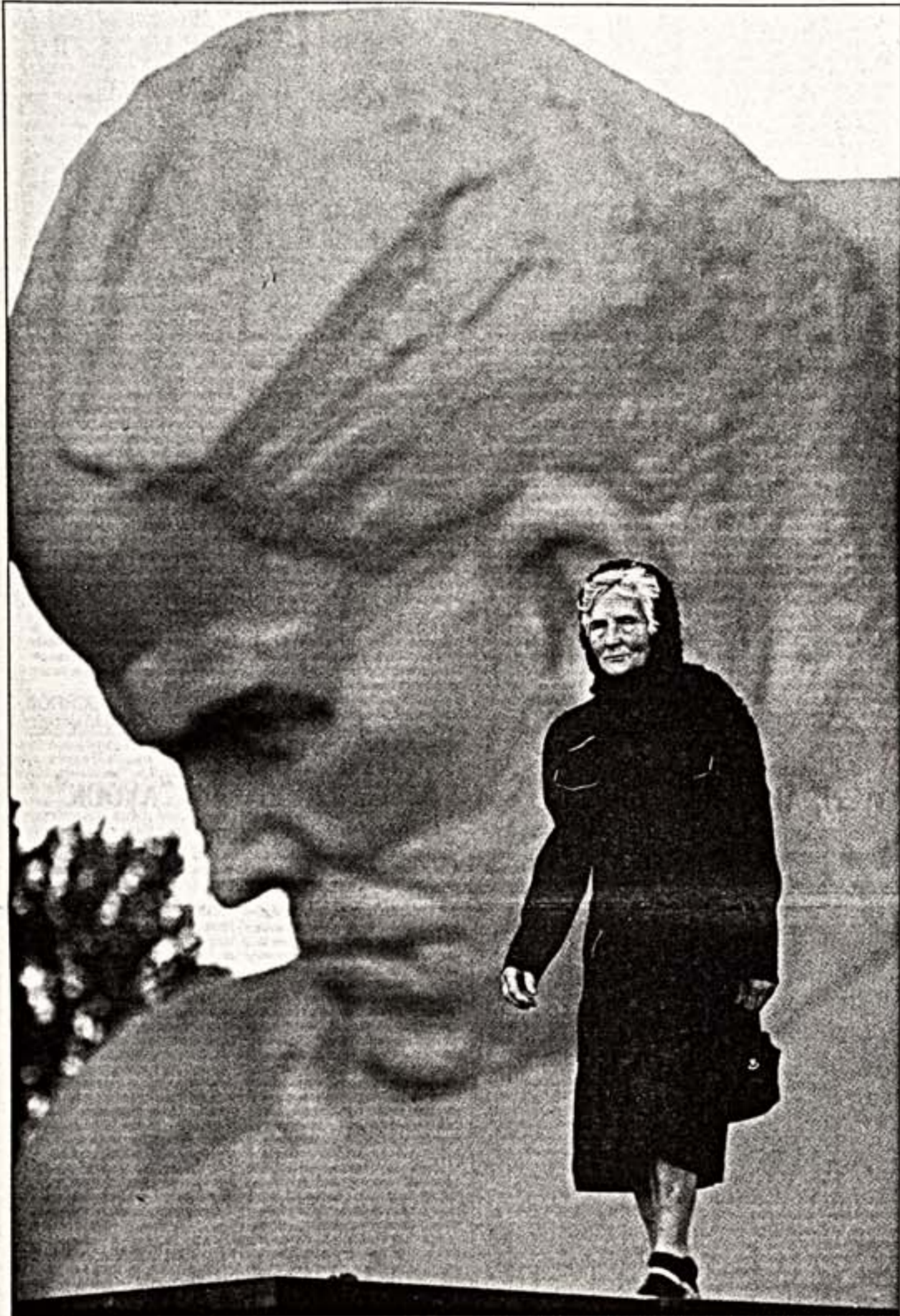
За все годы музей-крепость посетило более 20 миллионов человек

Крепость-герой стала самым интерактивным музеем войны