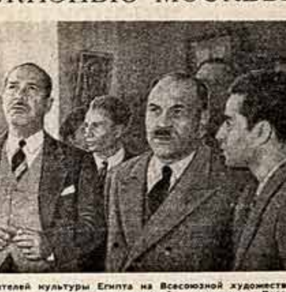
Делегация деятелей культуры Египта на Всесоюзной художественной выставке. В центре — министр национальной ориентации Республики Египет Фатхи Радаван.

В воскресенье гости побывали на выставке «Воскресение» в Большом театре.