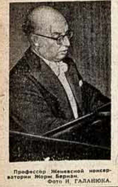
Профессор Женевской консерватории Жорж Бернан.

Адрес редакции: Москва, Б-04, Чистые пруды, д. 10а, издательство «Советская культура» К 7-10-03; отдел издательского дела К 7-10-03; отдел информации К 7-20-00; отдел приемов К 7-07-03; иностранный отдел К 7-07-03.