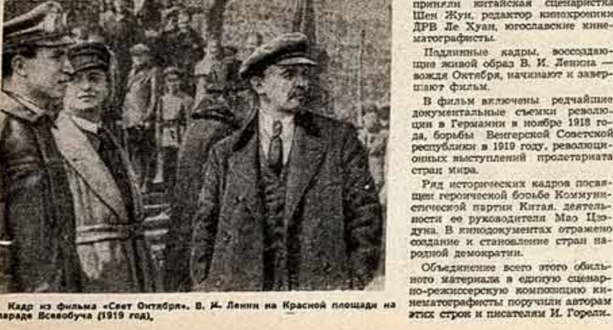
Кадр из фильма «Свет Октября». В. И. Ленин на Красной площади на параде Всевобуча (1919 год).

Кадр из фильма «Свет Октября». Товарищи Мао Цзюна и Чу Дэ направляются на площадь Тяньаньмин в Пекине в день провозглашения Китайской Народной Республики.