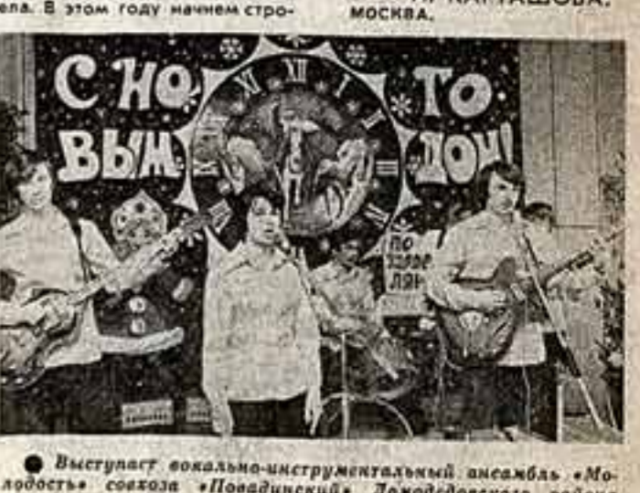
Выступают вокально-инструментальный ансамбль «Молодость» ансамбль «Поводнишки» Домоводского района Московской области.

«Мальчишке, едва различимые точки на карте. За каждой из них — люди. Они трудятся, отдыхают, учат детей, читают книги, сажают сады. Они строят новые дома и замечают в них веселые огни праздничных влол.»