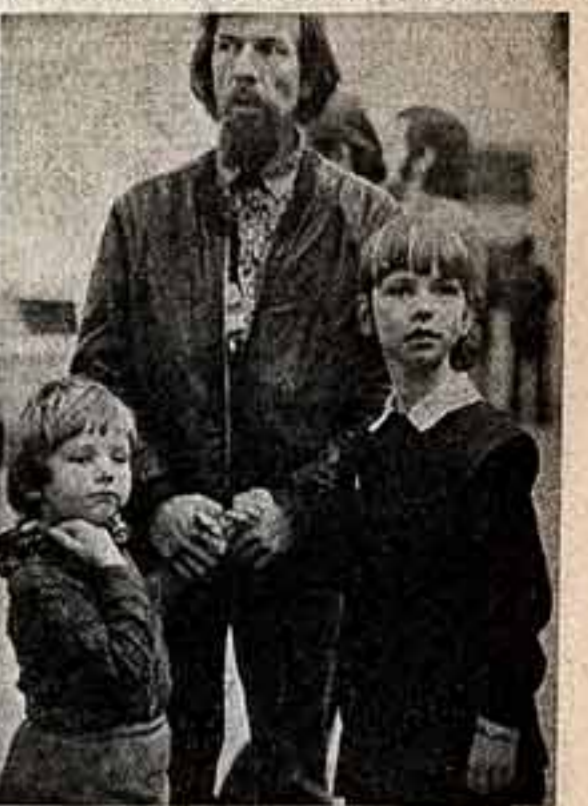
С палой на выспалке.

Люди и города К колеблею по давней традиции принято приносить подарки.