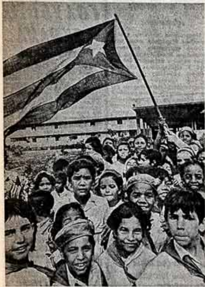
На марше молодость страны.