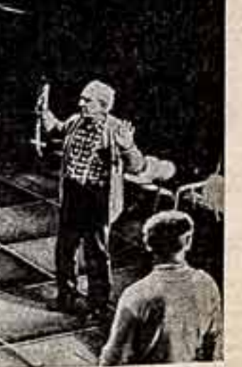
очень сложное и интересное, но вместе с тем и совершенно необычное. В Камерном театре начнем работать над «Потождением повесы» И. Стравинского и оперой молодого композитора В. Пальчуга «Ночью». В новом году труппе Камерного театра предстоит ответственная гастроли по Европе, где мы покажем разнообразный, серьезный репертуар. Этим покадам я придаю большое значение не только как руководитель коллектива, но и как деятель советского оперного искусства. Ведь в разных странах Запада до сих пор существует мнение об умирающем оперном жанре. И своими гастролями пропагандируя образцы русской и мировой классики, произведения советских композиторов, мы утверждаем обратное. Идет репетиция. (Б. Понровский и В. Атанович).

В Большом театре в новом году буду готовить спектакль «Ленинград». Это произведение композитора Э. Лазарева