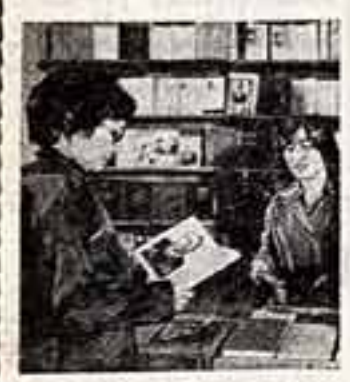
Большой популярностью у монгольских читателей пользуются издания здесь произведенная Генеральным секретарем ЦК КПСС, Председателем Президиума Верховного Совета СССР Л. И. Брежневым «Целина», «Возрождение», «Малая земля».