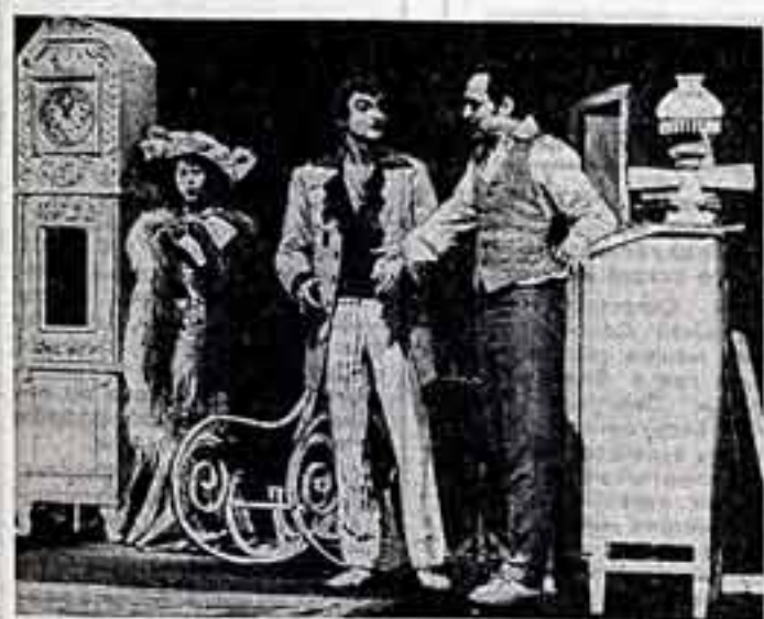
Сцена из спектакля «Тельо» по пьесе Б. Шоура в театре «Ландестеатер» города Галле.