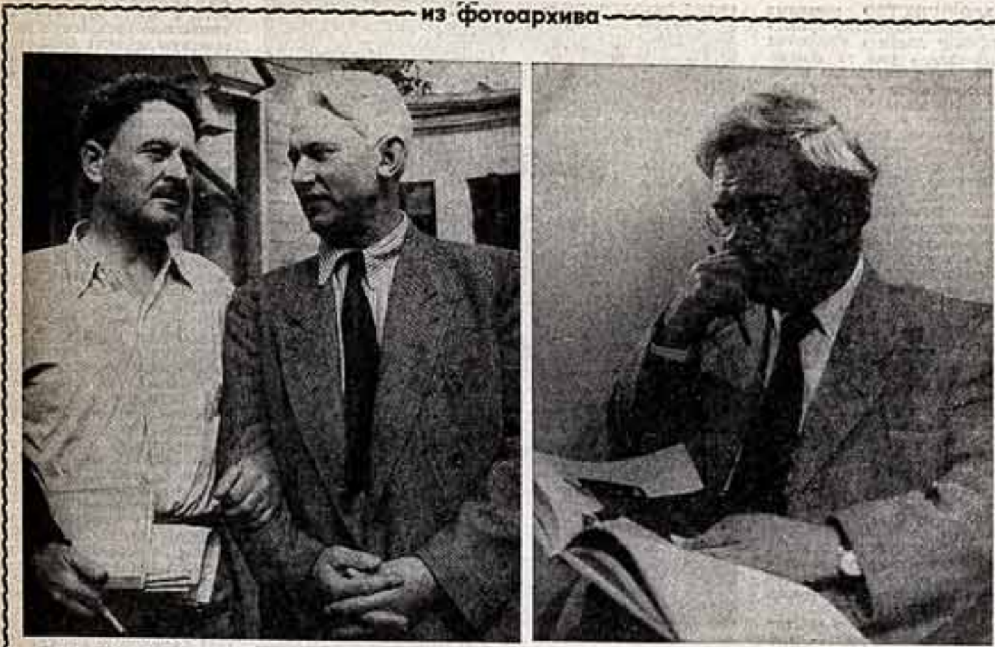
В. МАСЮКОВ. Писатели Н. Хакмет и А. Фадеев. 1951 года. Б. ВИЛЕНКИН. Народный артист СССР М. Штраух. 1957 года.