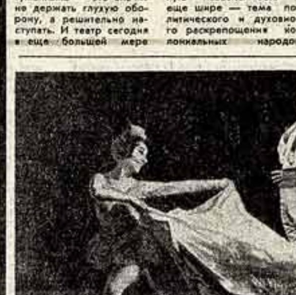
«КАРМЕН-СОНТА» В МОЛДАВИИ

«ИЗ зрительного зала в театре на эту тему, но все они ответственны за ее судьбу, за будущее человечества. «Из зрительного зала в театре на эту тему, но все они ответственны за ее судьбу, за будущее человечества. Постановщик «Лабиринта» советский театр выразил свою солидарность с борющимися Вьетнамом, и трудно забыть тот волнующий момент, уже выходящий за рамки спектакля, но в то же время как бы органически связанный с ним, — когда на сцену театра вышли, как массовые студенты, чтобы поблагодарить тех создателей постановки. А. РЫБИК, ТАШКЕНТ.