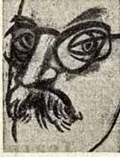
«Матисс, автопортрет» с обложки проспекта выпускного и праздничного концерта Матисса в Шатийоне.

«Сад Матисса» — под таким названием проходил шестой фестиваль культуры в Шатийоне.