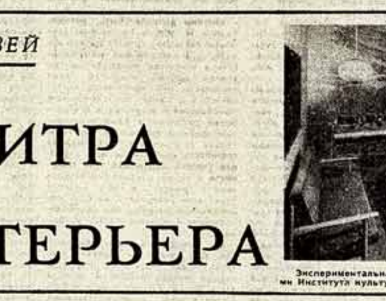
Экспериментальная квартира в Праге, разработанная сотрудниками Института культуры быта и одежд.