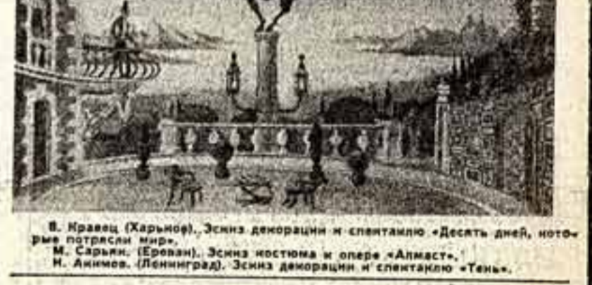
В. Краков (Харьков). Эскиз декорации и спектаклю «Десять дней, которые потрясли мир». М. Сарин (Ереван). Эскиз костюма и опера «Алмаз». Н. Акимов (Ленинград). Эскиз декорации и спектаклю «Таня».