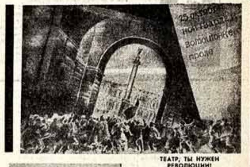
ТЕАТР, ТЫ НУЖЕН РЕВОЛЮЦИИ! Организаторы новой, открывшейся в Центральном выставочном зале выставки снова поразили зрителя удивительной, необычной, новаторской сценой экспозиции.