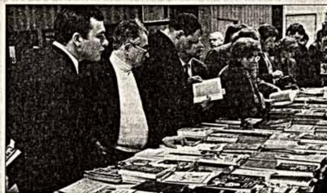
Антибукер, а как-то иначе, ничего восторженного бы не вышло.

Когда Россия вновь стала Россией, то есть государством, в числе прочих ее проблем (была, конечно, не самой важной) была и проблема создания своей национальной литературной премии. Идея англичан сделать своеобразный "фигил" своей национальной премии в России не только понятна, но и не может вызвать ничего, кроме благодарности. Это называется здоровой культурной экспансией без всякого отрицательного значения этого понятия. Богатая и самолюбивая культура обязательно занимается экспансией. И если только в своих давнишних традициях, она стремится доказать всему миру свое превосходство. И если это делается не лужками