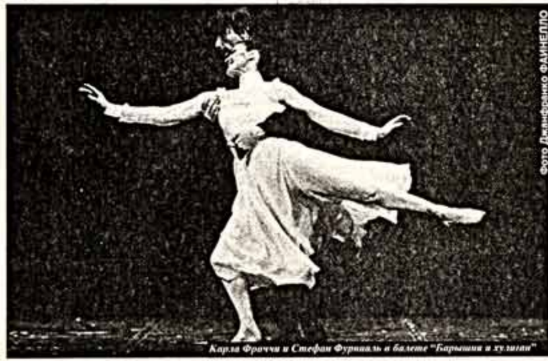
Карла Фраччи и Стефан Фурчилья в балете «Барышня и хулиган»