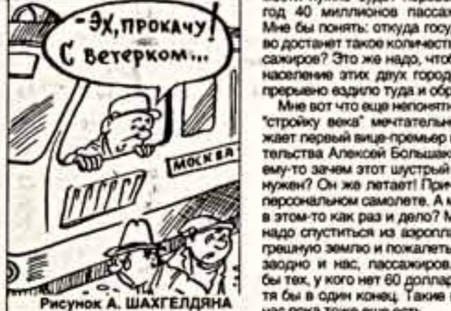
Рисунок А. ШАХЕЛДЯНА

Так что, сдается мне, рублем мы железом этой "сверхкороткой" по льду земли-матушки. Хотя камыши я употребил напрасно: дорога эта действительно сверхкороткая. Поезда будут идти со скоростью 350 километров в час. И отправляться каждые 15 минут, то есть никаких очередей в кассах. Ист, правда, и сейчас нет. Кассы пустуют — поток пассажиров. Так вот что насчет самокопачности. Я изжужу подотчет своих поборников "стройки века". Даже по их подсчетам, для самокопачности нужно будет перевезти в год 40 миллионов пассажиров. Мне бы понять: откуда государство достанет такое количество пассажиров? Это же надо, чтобы все население этих двух городов непрерывно ездил туда и обратно. Мне вот что еще непонятно. Эту "стройку века" мечталось обоим первым вице-премьер правительства Алексеем Болдыковым. Но ему-то зачем этот шустрый поезд нужен? Он же летает! Принцип на персональном самолете. А может, в этом-то как раз и дело? Может, надо спуститься из атмосферы на трещинку земли и покатать ее? А засорю и нас, пассажиров. Хотя бы тех, у кого нет 80 долларов, хотя бы в один конец. Такие ведь у нас пока тоже еще есть.