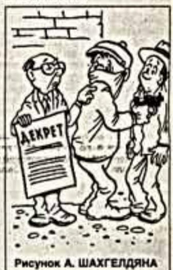
Рисунок А. ШАХГЕЛДЯНА

...В документе оговорено, что служащие государственного аппарата, должностные лица