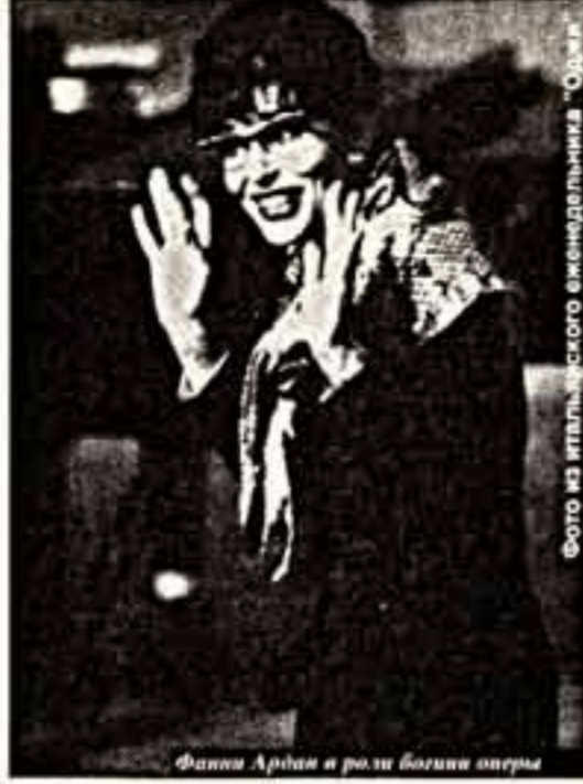
Фанни Ардан в роли великой оперы