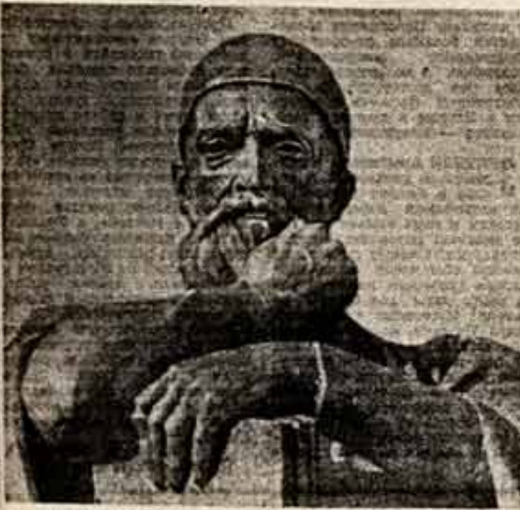
Т. МАМЕДОВ, О. ЗЕЛДАРОВ. Фрагмент памятника М. Фузули.