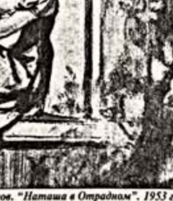
Д.Шмаринев. "Наташа в Отрадном". 1953 г.

Великий иллюстратор Деметрий Шмаринев долго жил в Рязанской области. Здесь художник полюбил в камнате для значительных гостей. В ней до него жили Регин и Нестеров. Художник тщательно изучал материалы, относящиеся к исто-