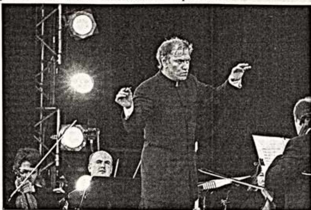
В. Гергиев с оркестром Мариинского театра на Пасхальной горе