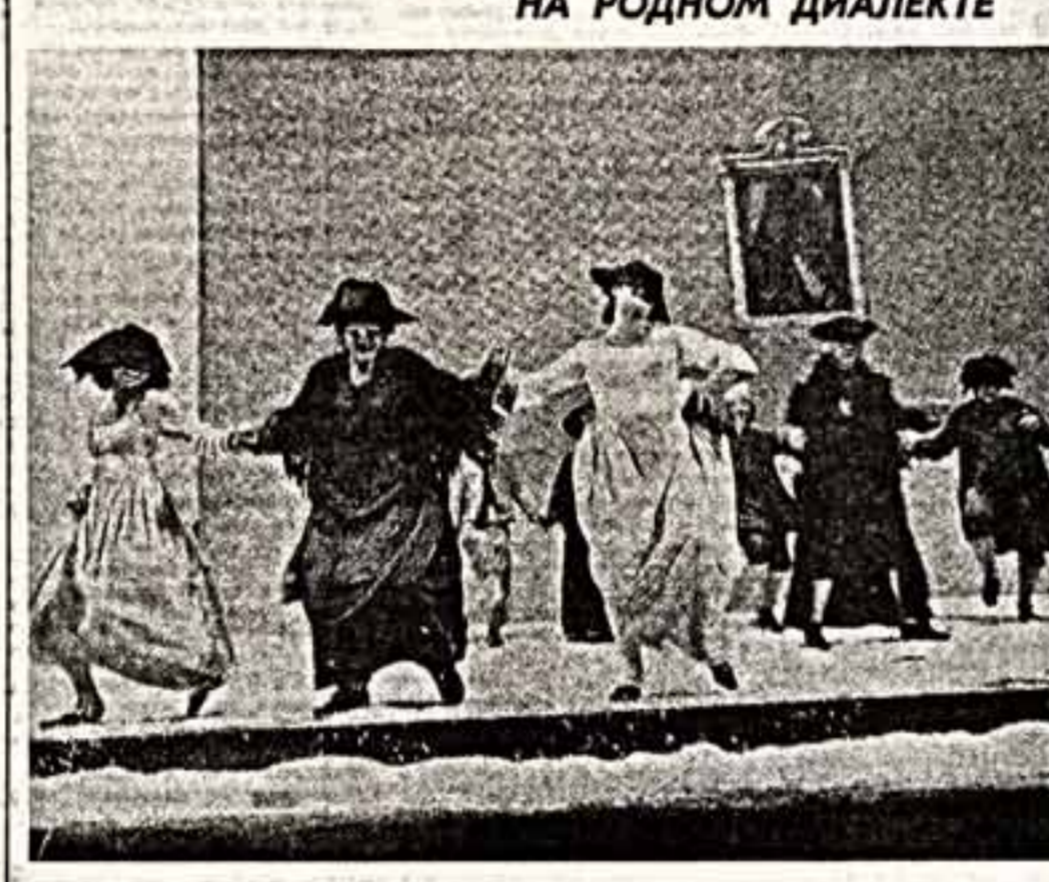
Сцена из спектакля Дж. Стреллера «Перекресток».