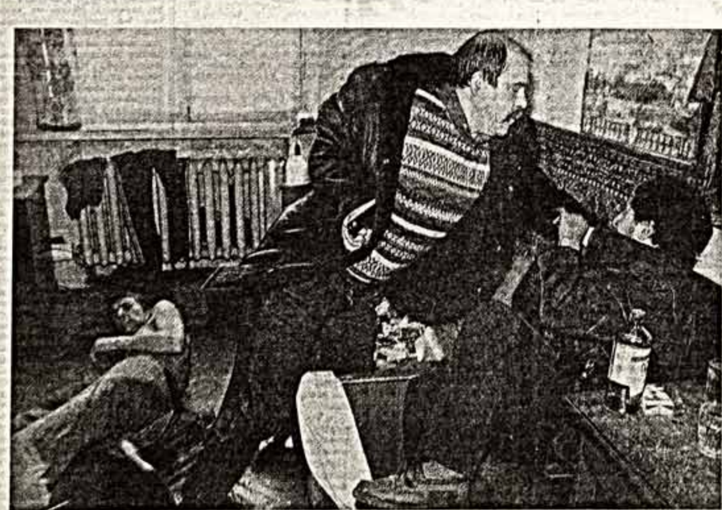
Милиционерский рейд в одной из московских квартир.