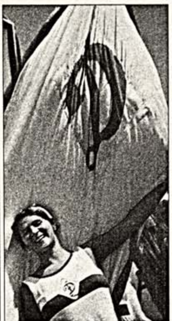
"Динамовка". 30-е годы.