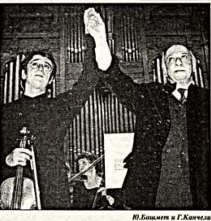
Ю.Башмет и Г.Канчели