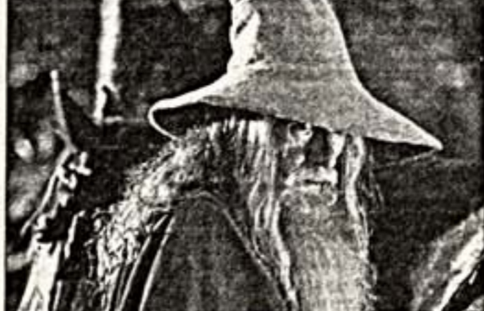
Кадры из фильмов "Ничейная земля" (вверху), "Тосфорд-Парк" (справа) и "Властелин колец" (внизу)