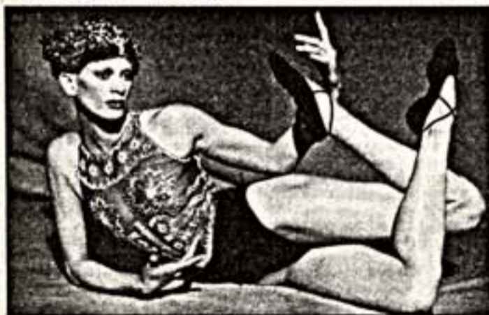
П.Линдберг. "Посещение Дишлеу", 1993 г.