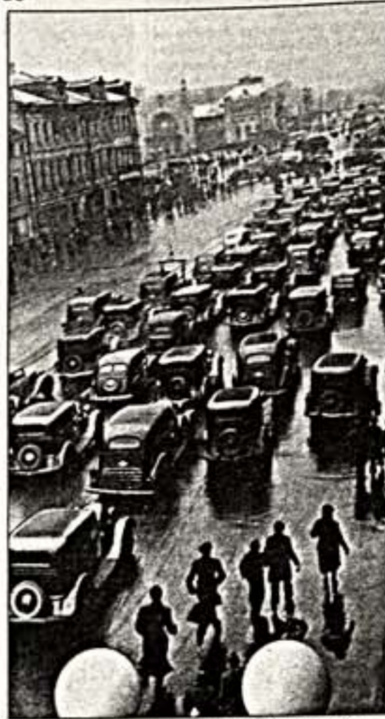
"На футбол", 1945 г.