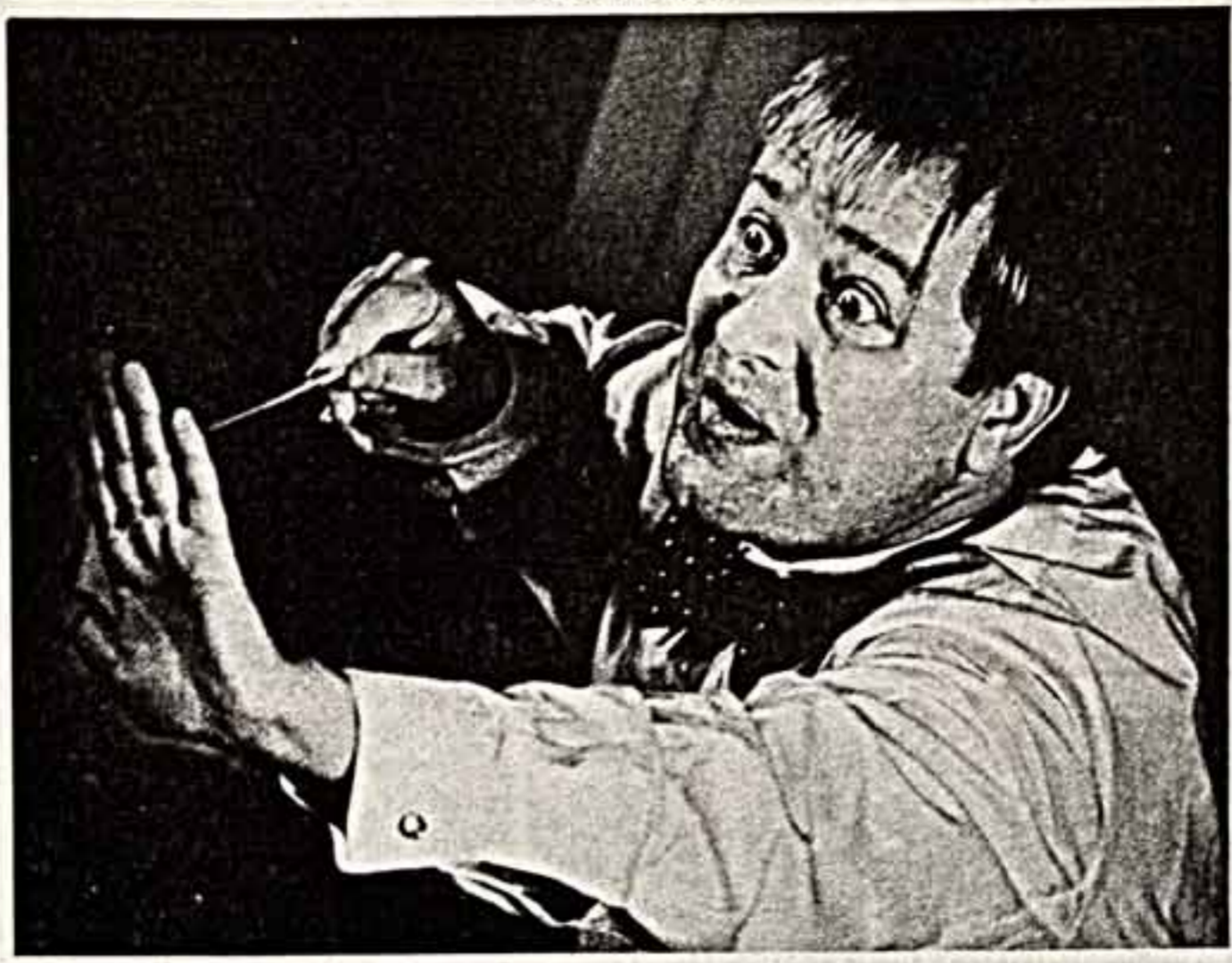
Второй куклы Фальшманге — ив-бескар! Дирижировал народный артист СССР Стефан Турчак.