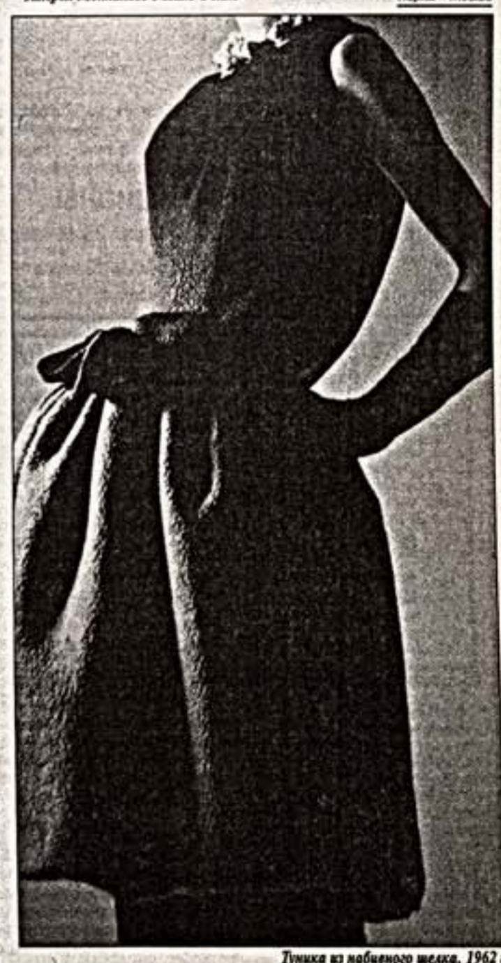
Линия из набивного шелка, 1962 г.