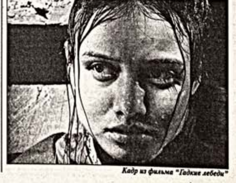
Кадр из фильма "Гадкие лебеди"