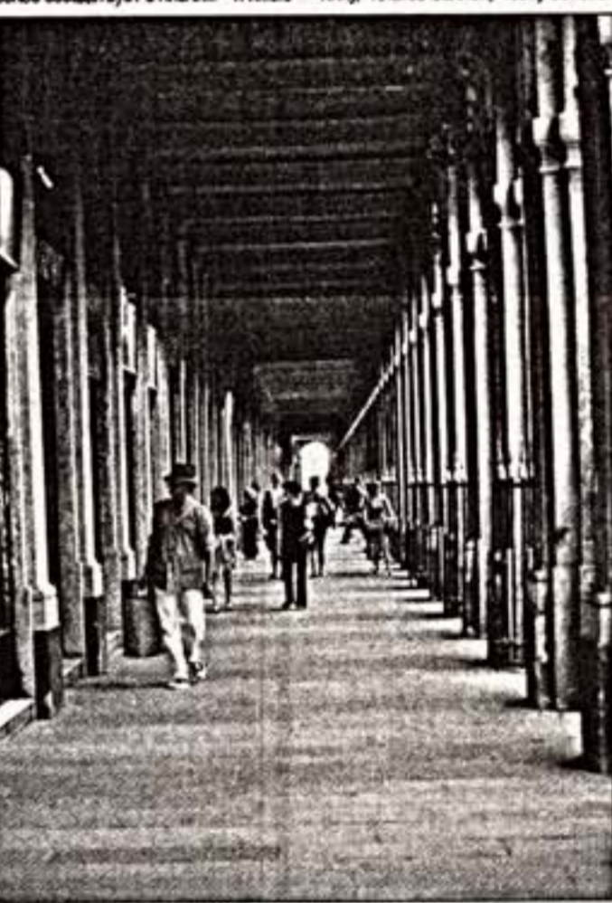
Галерея Монпансье в Пале-Рояле