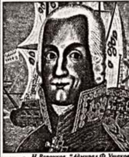
Н.Воронов. "Адмирал Ф.Ушаков"

Выставка под таким названием открылась в Иркутском музее изобразительного искусства. Иркутск, на основе советской эпохи, экспозиция печатной и южной графики, рисунка и авангарда. Прогрессивная и очень популярная. Прогрессивная и очень популярная. Прогрессивная и очень популярная.