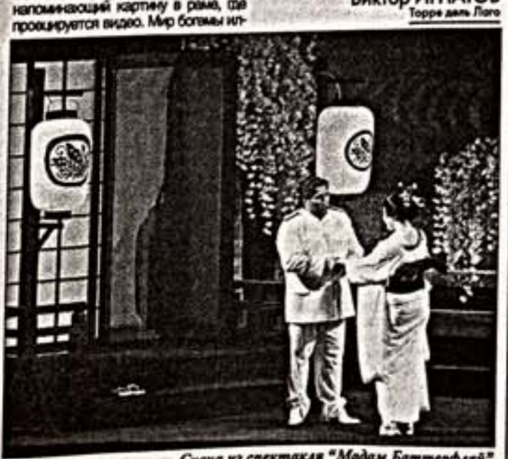
Сцена из спектакля "Маддам Баттерфляй"