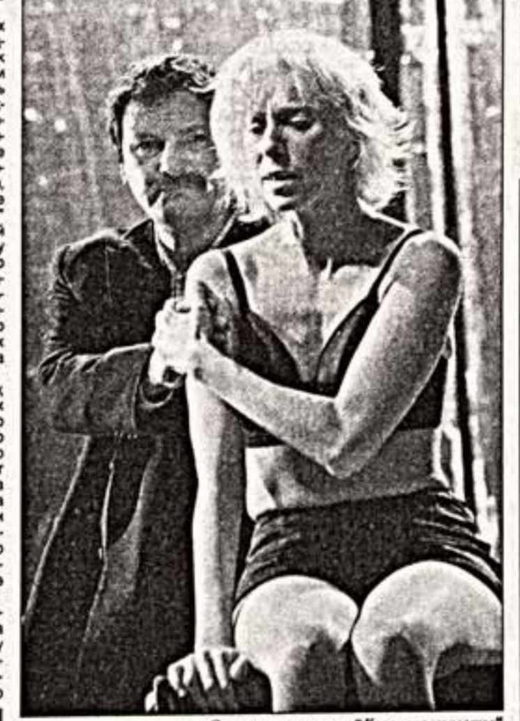
Сцена из спектакля "Королева красоты"