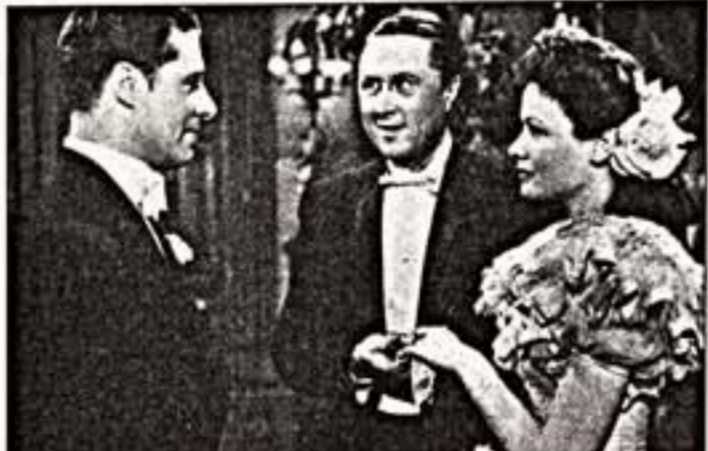
Кадры из фильмов "Нивеманг" и "Небеса могут подождать"