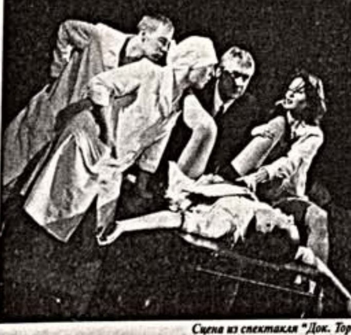
Сцена из спектакля "Док. Тор"