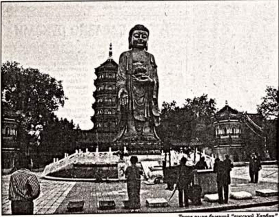
Таков ныне бывший "русский Харбин"