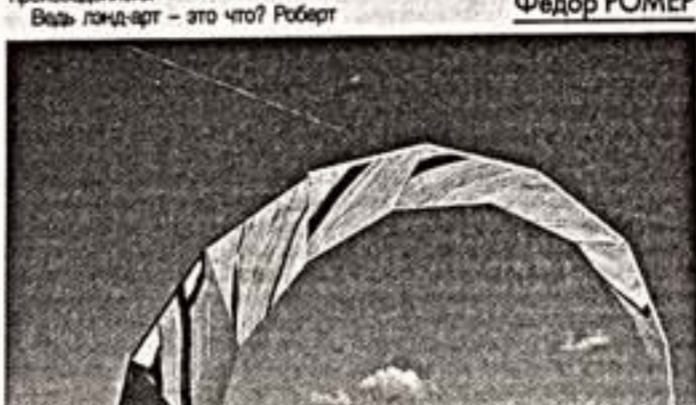
Ф.Инфанте. "Очаги искривленного пространства". 1979 г.

Ибо, как и сказано, четыре этажа ММСИ сплошь заставлены работами четы. Каталог неподъемен и недоступен по цене. Количество произведений — это искусство, которое не позволяет себе ругать пилотажную технику. Инфанте — и Горюновой — не надо было входить в историю в плане земли. Хотели финансировать свои собственные проекты, симулякры на фотопленке (фотобунары) — в отличие от природы — все стерли. Искусство Инфанте — Горюновой — это по-прежнему ландшафт, чертёж Симитона или Кристо (перелом, обнуление Рейкстаг блондинкой). Это русское искусство, нежеланное ввиду его возмущающего конкретного работа, уничтожения. Но то, которое лаже горды.