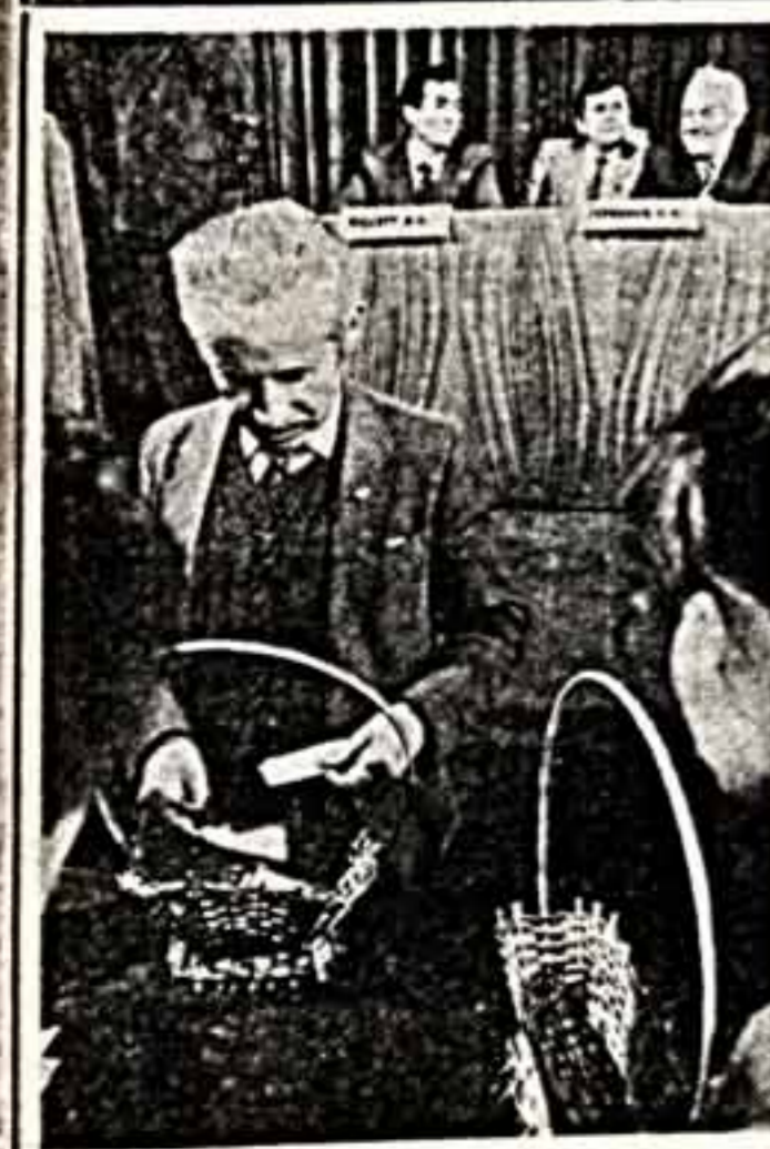
Делегаты вносят предложения на заседании пленарного заседания конференции трудового коллектива завода «Азнефт».

В 1983 году Совет Министров Азербайджана поручил объединению «Азнефт» рекультивировать в двенадцатой пятилетке на территории Апшерона 7.210 гектаров. В том числе в 1986 году 1.050 гектаров. Кроме того, институту «Азнефт» поручалось в первом полугодии 1986 года подготовить проектно-сметную документацию на рекультивацию нарушенных