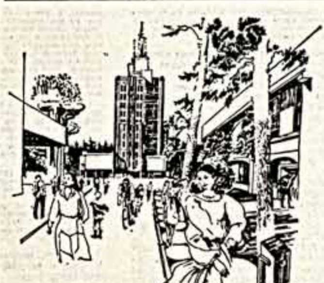
На берегу Днепра, в Репинском районе Черниговской области, строится город энергетиков Славутин, где будут трудиться труженники Чернобыльской АЭС.