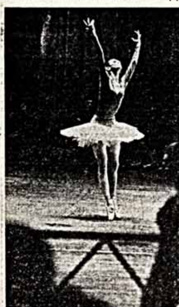
● Людмила Семелка, народная артистка СССР, — одна из ведущих солисток прославленного Большого театра СССР. Ее мастерство снискало любовь поклонников балетного искусства.