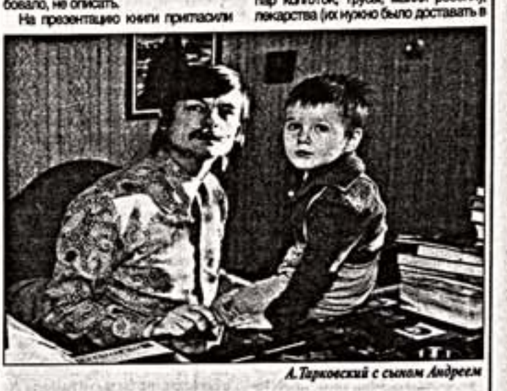
А.Тарковский с сыном Андреем

Наконец-то вышли на русском языке "Дневники" Андрея Тарковского, давно переведенные и изданные на итальянском, немецком, английском и других языках. 20 лет ждали эти события и несли средства на публикацию, но не издавали. И самое удивительное, если не сказать печальное, что русскоязычный вариант вышел благодаря итальянскому банку Антонио Фалло, который нашел на это средства. Это наиболее полный текст в сравнении с предыдущими итальянскими изданиями. Много уже написано о Тарковском — его острей, близко знавшими его людьми и критиками, но собственное его тексты мы еще не читали в таком объеме. Теперь же благодаря усилиям сына Андрея Ароновича, Андрея Тарковского-младшего, немцам удалось держать в руках эту книгу, изданную небольшим тиражом — 5 тысяч экземпляров, отпечатанную от которой просто невозможно. Тексты снабжены фотографиями и рисунками самого Тарковского, которые хранятся во флорентийском архиве. Именно там Андрей Тарковский собрал личные материалы режиссера из Москвы, Рима, Лондона и Парижа. Тарковский назвал свою книгу "Мартиролом" — перенес страдания, а в конце, заключительный, как оправдал этот сам. Читая страницу за страницей и думая о том, на что ушла жизнь, не так уж и длинная. На борьбу с чиновниками, которые сломали самые близкие связи, фигурирует почти на каждой странице: Ермак, Сизов и так далее. На подписание одного только контракта с итальянцами ушло несколько месяцев, а укладываясь в срок, он успевал увидеть и сил все это требовало, не отпуская.