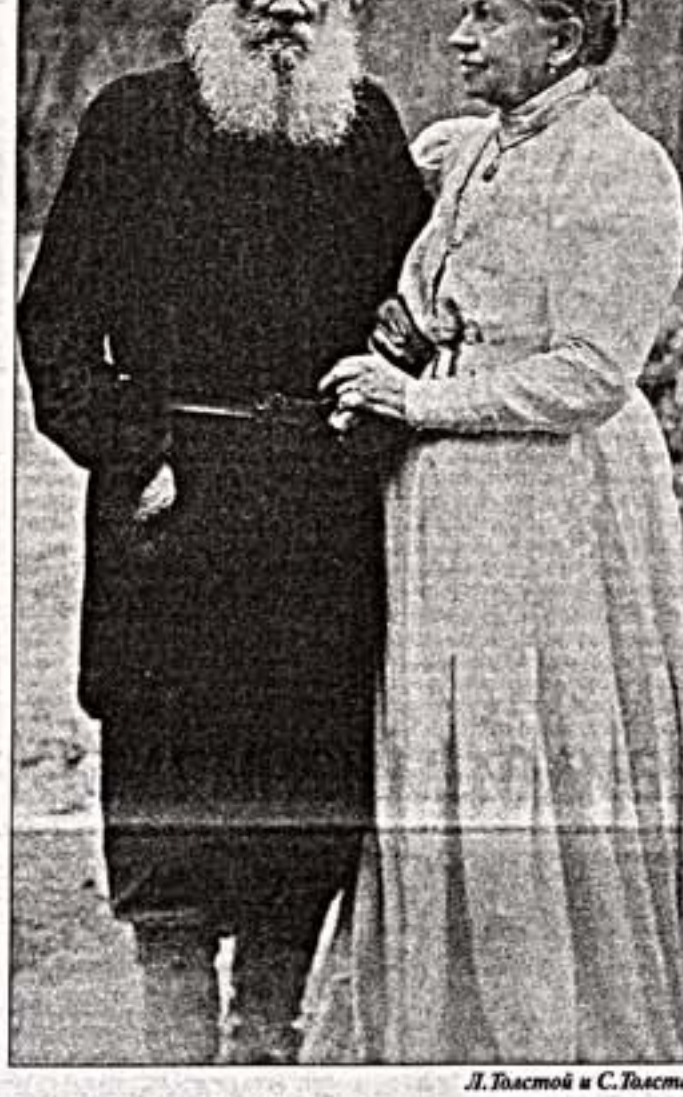
Л. Толстой и С. Толстая