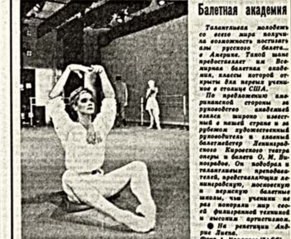
Публикацию подготовил А. ГАСПАРЯН.

Талантливая молодость со всего мира позвала. Возможность воспитать из русского балета... в Америке. Такой шанс предоставляет или Великая балетная академия, классы которой открыты для первых учеников в столице США.