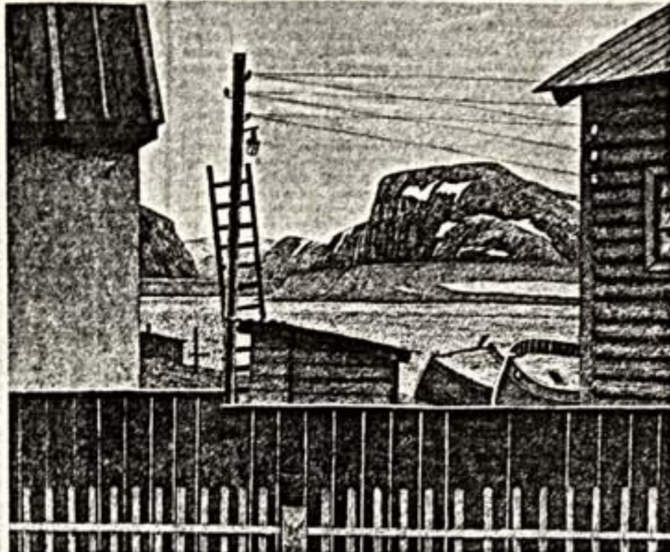
Т. МЕДВЕДЕВА. Подойшо время традиционного присуждения Государственных премий РСФСР...