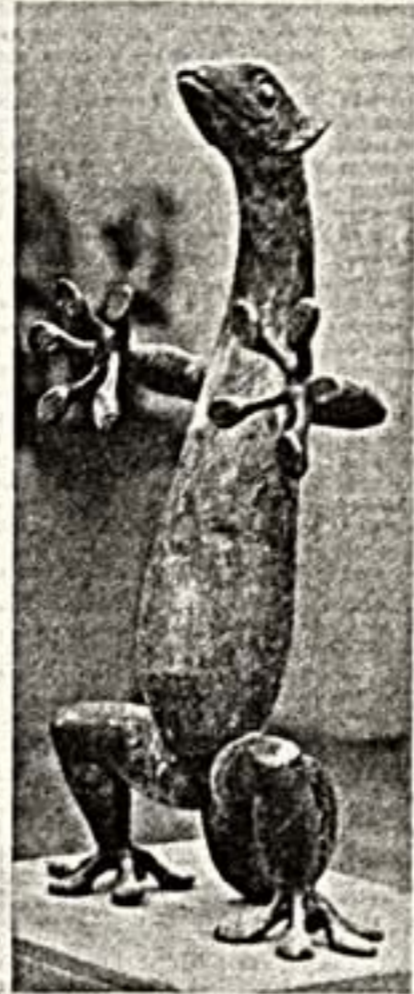
Н. Руховишников. «Ищерица».