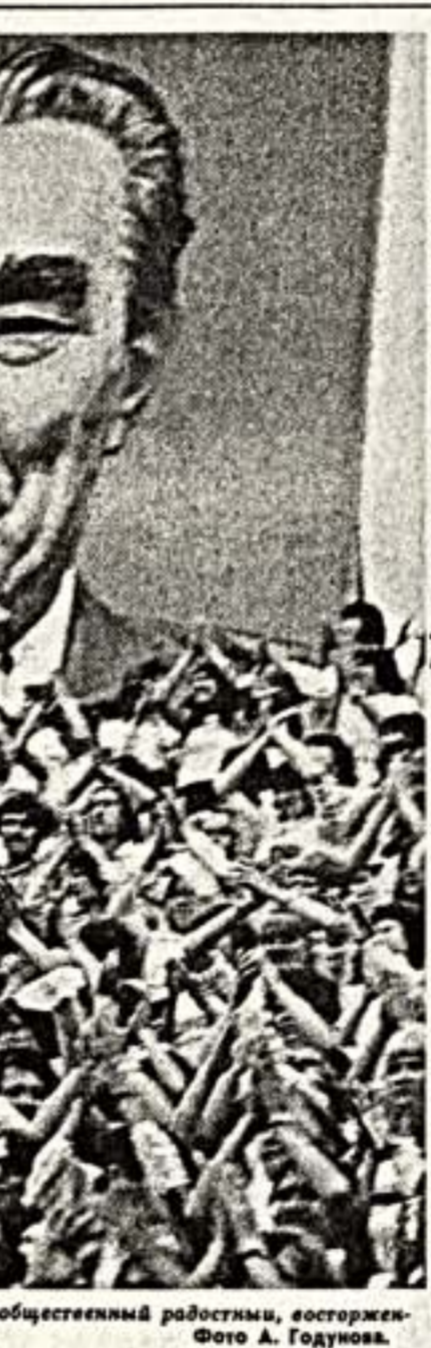
«Все мы жили на два профиля — общественный работный, восторженный и внутренний — трагический...»