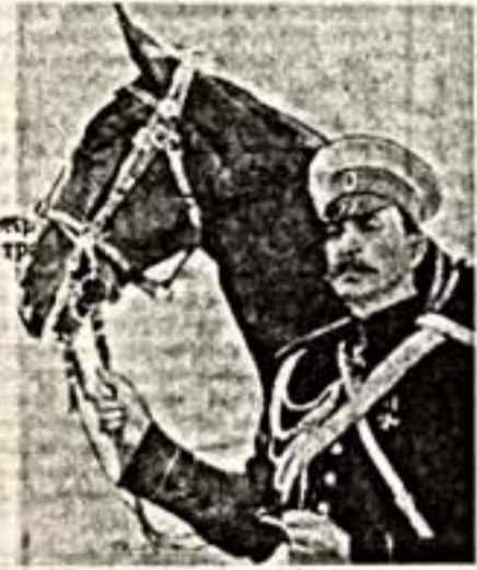
Фото из газеты «Интернэшнл геральд трибюн» (США).