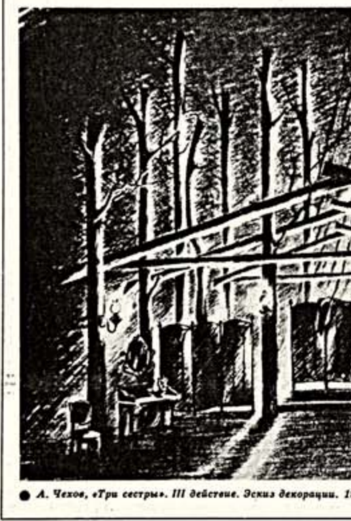
А. Чехов, «Три сестры». III действие. Эскиз декорации. 1981.

Ковергин получил звание лауреата Государственной премии СССР. Э. Радзинский, «Монолог о браке», И. Друц, «Возвращение на круги своя», Гоголь, «Ревнивая сказка». Эти макеты участвовали в международных триеннале и международных смотрах и костюма и были отмечены серебряными медалями. Чудесные макеты так в себе безудержный хохот балетного и мудрость интеллектуального опыта народа, спрятавшегося в его смеховой культуре, мало изученной и мало понимаемой сегодня интеллигенцией. К большому сожалению, потому что это смеховая народная культура и есть прелесть. Н. ДАНИЛЕВИЧ. А. Пушкин, «Борис Годунов». Макет (фрагмент). 1973.