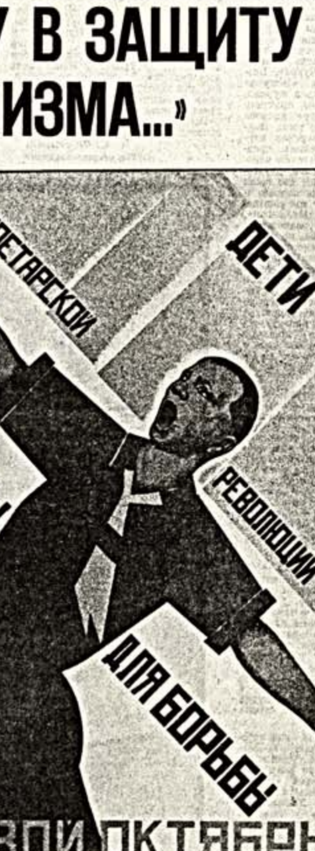
Плакат художника В. Шестянова.

На этой газетной странице представлена необычная читательская почта. Необычная по сегодняшним временам, отмеченным буйством демократических проявлений, созданием новых партий, митингами и забастовками, спорам о рынке, о совместных предприятиях, разговорах о товарах, продуктах и вообще — о том, как нам выжить, пережить кризис.