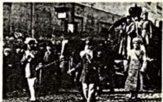
Инсценировка «Похороны Самодержавия» в колонии демонстрантов на улице Москвы 7 ноября 1918 года.

КОЖА ИСТОРИИ ШЕЛУШИТСЯ, ПРЕВРАЩАЯСЬ В КИНОПЛЕНКУ