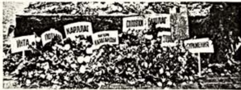
Москва. Сто метро до здания КГБ. Закладка памятника жертвам репрессий тоталитарного режима.