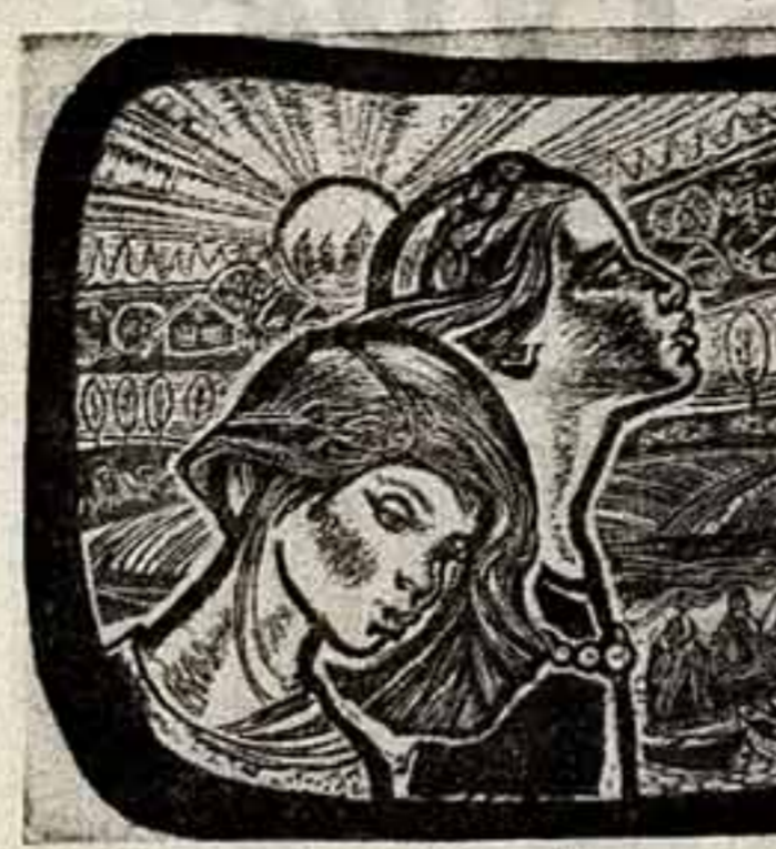
«Песня в Родину».

советской жизни — как красное, показанное художником!