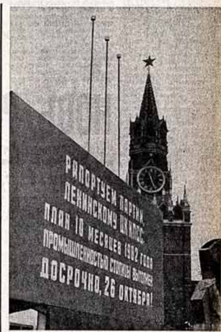
Москва, предпринимая.

Вот почему так важно, как складываются наши отношения с другими странами. Немалое значение имеют отношения с Китаем. Мы искренне хотим нормализации отношений с этой страной и делаем все зависящее от нас в этом направлении.