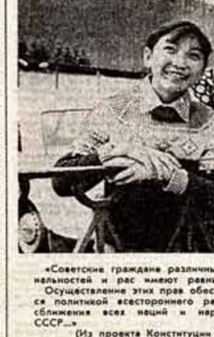
«Советские граждане различных национальностей и рас имеют равные права. Осуществление этих прав обеспечивается политической эстеторинеро развития и сближении всех наций и народностей СССР».