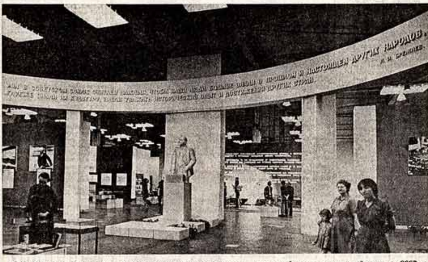
В Москве, в Центральном выставочном зале, открыта выставка книг зарубежных авторов, изданных в СССР в 1917—1977 гг.

Вперед! — 60-летие Великой Октябрьской социалистической революции. Для общества охраны памятников истории и культуры особенно важно сейчас всемерно улучшить пропаганду памятников советской истории, убедительно показывая через них живую силу идей Октября.