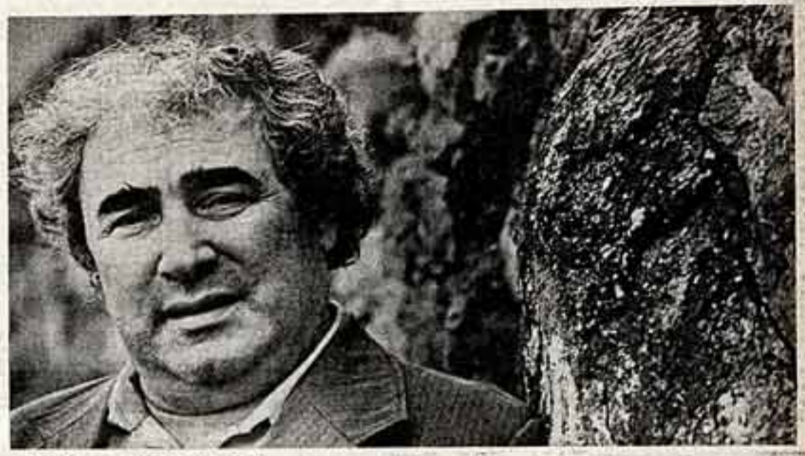
Нубар Джубаде, 1976 год.