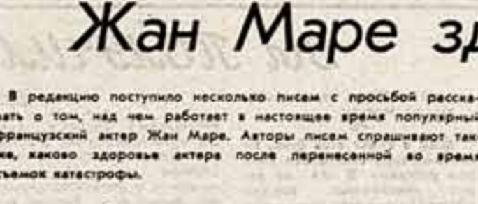
Жан Маре здесь, Жан Маре там...

Жан Маре выдержал испытание. Мольером достоин, вновь убедил публику в широкой сфере возможностей. Его Тартоф с пыльным цветом лица и размытым подбородком, энергичный и шумный мало чем на-