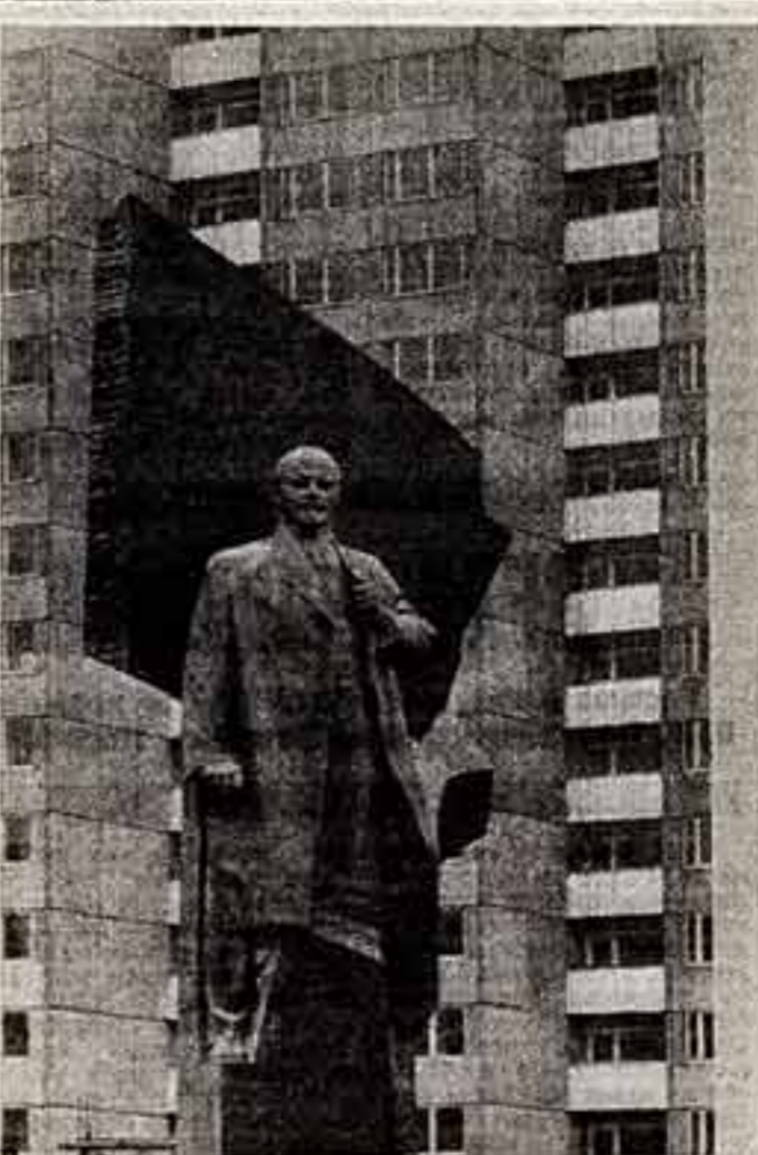
Памятник Владимиру Ильичу Ленину в Берлине, спроектированный по проекту советского скульптора народного художника СССР Н. Томского.

Для участия в фестивале выехала делегация советских кинематографистов.