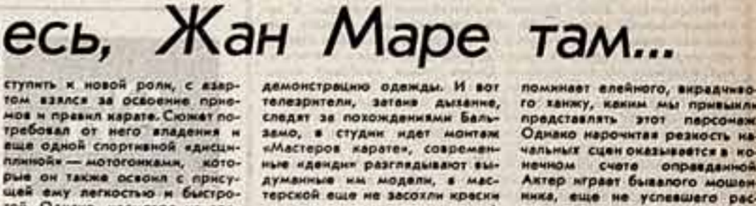
Жан Маре здесь, Жан Маре там...

Т. МАТИНОВА, иерр. ТАСС — специально для «Советской культуры», ВАРШАВА.