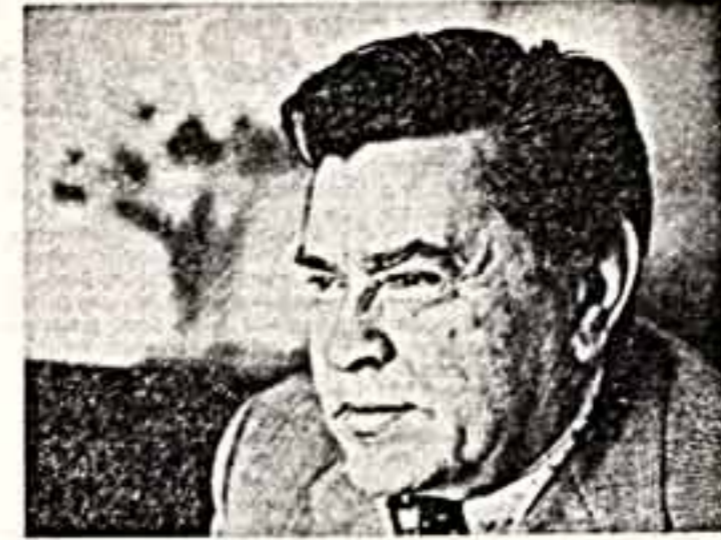
Советский комитет ветеранов войны и меи избрал его ответственным секретарем, обрадовался очень, как-то сразу на месте себя почувствовал. Сейчас Маресьев первый заместитель председателя комитета. Во множестве приходящих на его имя писем встречается строки: «Наверное, вы родились таким!» — Я родился volcanoном, — отвечает Алексей Петрович. И этим, пожалуй, сказано все. Безмерная любовь к Волге, к землям, благодарность им и за советы, и