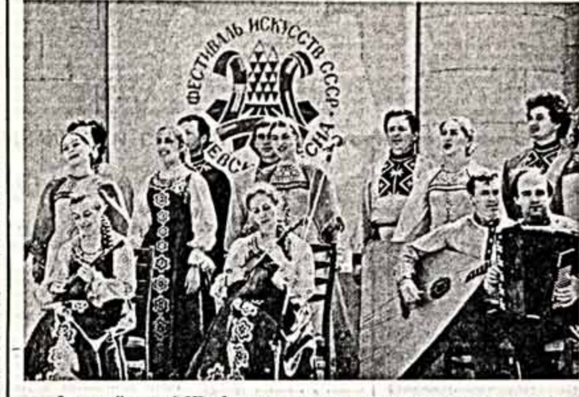
В столице Украинской ССР с большим увлечением проходит сороклетний Всесоюзный фестиваль искусств «Киевская весна». Яркий праздник дружбы открылся во дворце культуры «Украина» и сейчас продолжает свою торжественную поступь. Киевские тепло принимают гостей из других республик нашей страны. • Выступает Украинский русский народный хор. • Таежаские рубашки и артистам Киевского ансамбля «Кавказский балет».

Активная жизненная позиция складывается не только из творчества, но твоей сопричастности ко многим явлениям жизни. Современного человека ругают за малоподвиж-