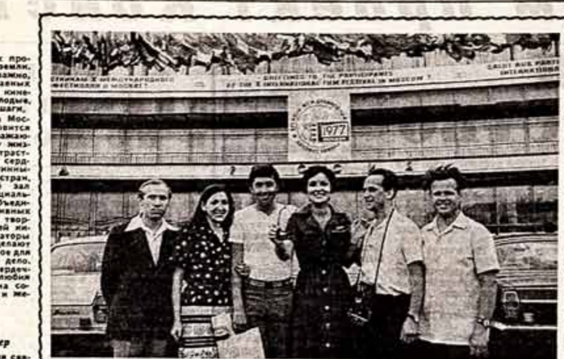
Кадр из СИНДО.