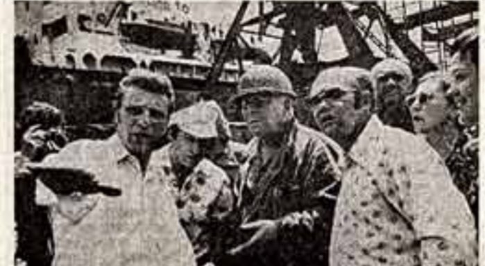
Гастрольное лето в разгаре. Многие театры страны отправились на встречу с новыми зрителями. Так, Хабаровский театр музыкальной комедии посетил в Приморском крае Уссурийск, Арсеньев, Находка и Владивосток — такой маршрут их гастроль. В Находке артисты побывали в гостях у труженников Приморского судоремонтного завода.