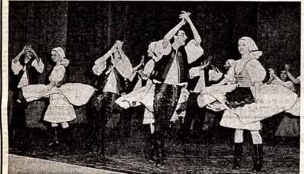
Танцевальный студенческий коллектив Братиславского университета имени Коменского пользуется большой популярностью не только у себя в стране. Сейчас молодежный ансамбль готовится выступить на международной фольклорной фестивале во французском городе Конфлан.

Вы «перешли» в режиссуру? — Но я никогда не бросал писать и в сентябре должен закончить новую пьесу. Последнее время я сам ставил свои пьесы. Много присутствовал на репетициях режиссеров Жаана-Луна Барро, А. Швайгера, Ф. Деффрели и сам решил попробовать себя в режиссуре. Поставил «Кто боится Вирджинии Вулф?». Что получилось — не мне судить. — Что вы пишете более всего на то, что написали в последние годы? — Я люблю свою пьесу «Морской пейзаж». Она написана в 1975 году. Я долго ее вынашивал. Когда пьеса была опубликована, критики обобщили ее как «прыжок в фантазию», помешанный на «беспощадный реализм» — ярлык, который приклеили автору со времен «Вирджинии Вулф». — Любят ярлык опасный, — говорит Э. Олби, — у меня свой словарь, и «фантазия» в моем понимании означает «песню воображения, мечты». Все пьесы, по существу, фантазия.