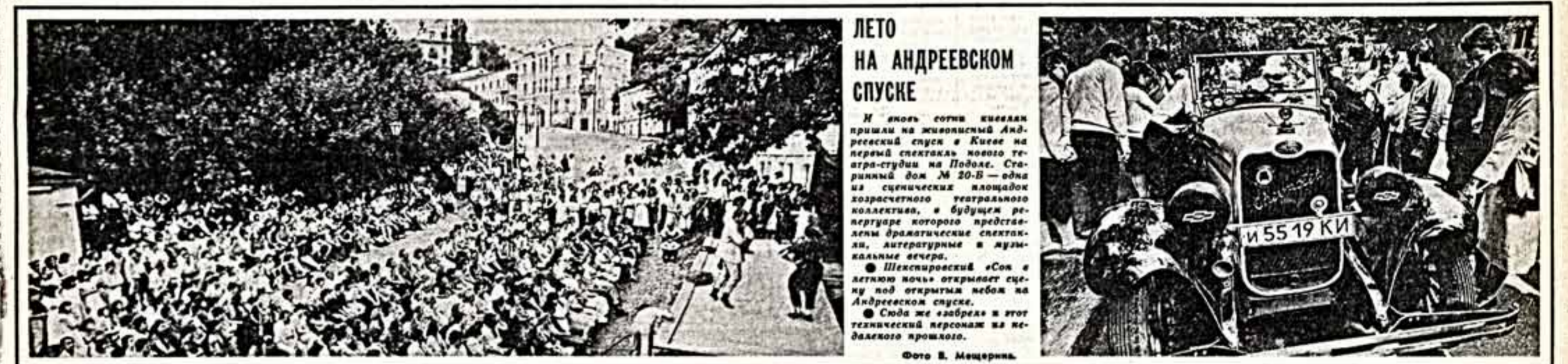
ЛЕТО НА АНДРЕЕВСКОМ СПУСКЕ И вновь сотни человек пришли на живописный Андреевский спуск в Киселево на первом спектакле нового театра-студии на Подоле...

В. ПОЛИКАРПОВ, доктор исторических наук.