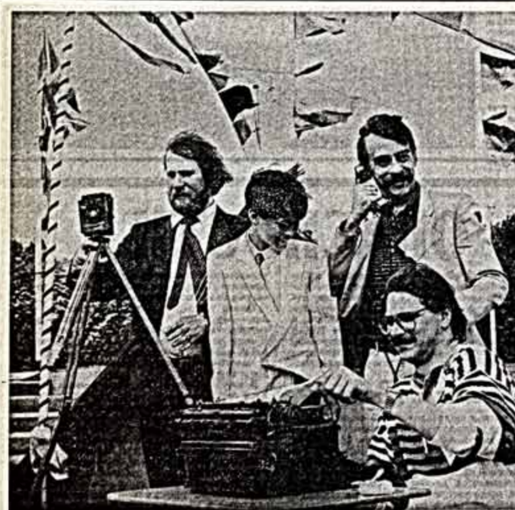
Участники премьеры — члены съемочной группы фильма «Мно люб Мило»...