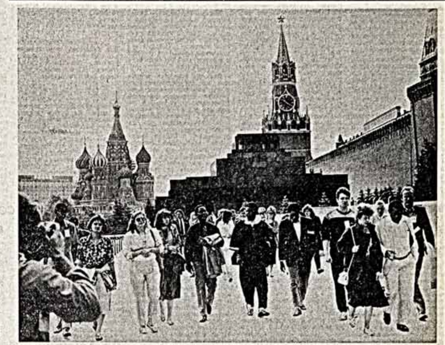
американский кинорежиссер Роберт де Ниро, возглавляющий на фестивале жюри... Началось напряженное фестивалевое дни и еще для двух жюри — взрослого и детского, приступили к конкурсам просмотром во Дворце пионеров на Ленинских горах. Им предстоит выбрать лучший детский фильм из десятка, представленных на фестивале 37 странами. Между тем один из главных призов жюри уже вручили на торжественном открытии кинофестиваля — 1300 ленинских рублей — для всех, кто пришел в тот день приветствовать участников в гостях детского фестиваля.

Состоится пресс-конференция кинематографистов Бразилии, Индии, Югославии, Вьетнама, Китая, Мексики. На вопросы советских журналистов ответят популярные