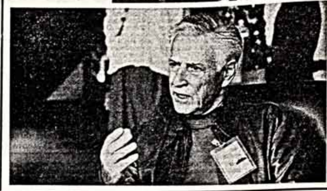
Их предстоит работать вместе — председателю жюри...