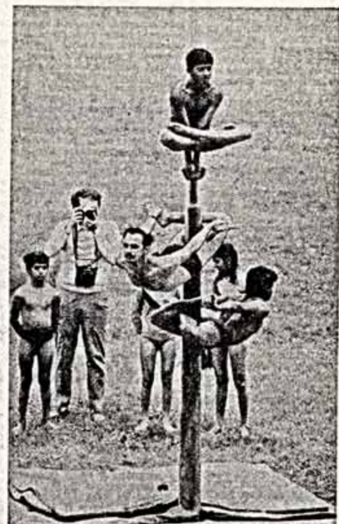
Это — есть махалааб.