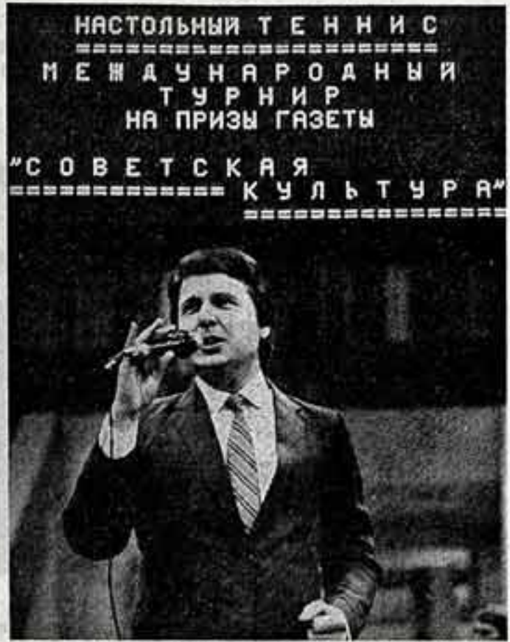
Настольный теннис. Международный турнир на призы газеты «Советская культура»

На Малой спортивной арене Центрального стадиона им. В. И. Ленина продолжается Международный турнир по настольному теннису на призы газеты «Советская культура»