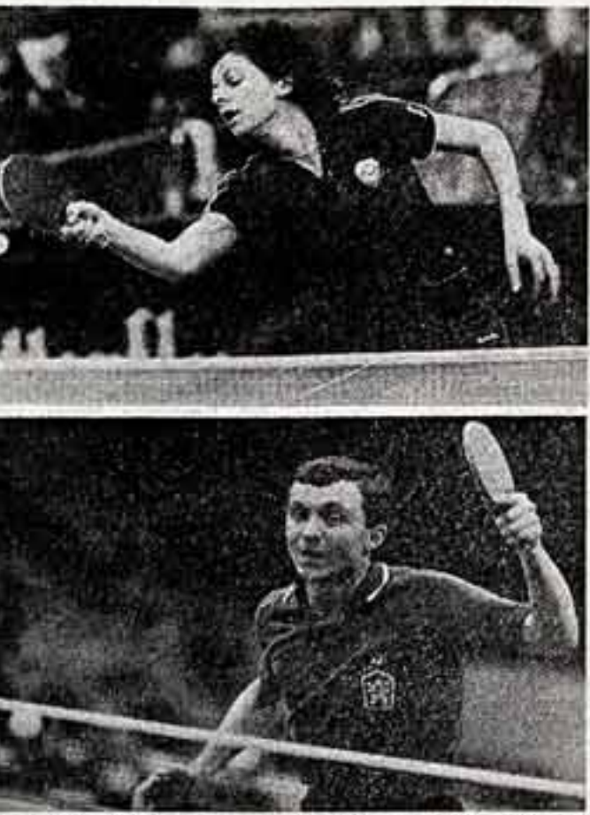
Настольный теннис. Международный турнир на призы газеты «Советская культура»