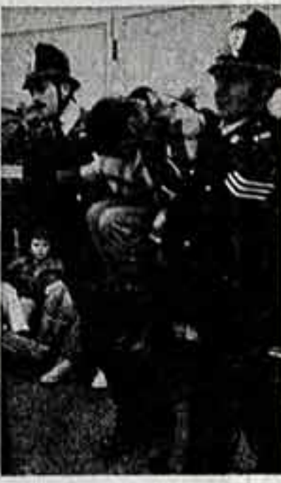
Арест участникам демонстрации.