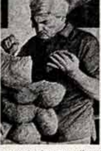
Жан Марэ играет в спектакле популярного парижского театра «Мадлен»...