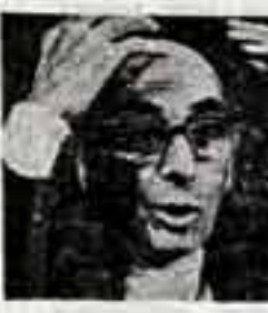
Тамаш Майор широко известен как режиссер...