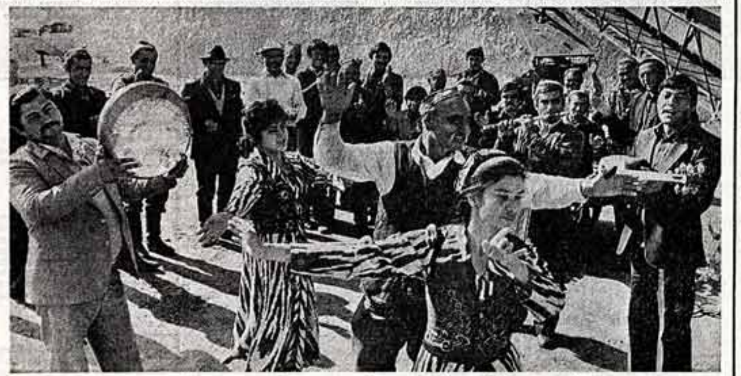
Богатый урожай хлопков собрали в этом году труженики Ферганской области Узбекистана. На заводских прикатах и ночью кипит работа. В объединенном центре к хлопководам Ферганского района приехал с концертом народный ансамбль районного Дома культуры «Родник».