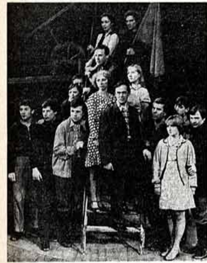
Революционное, героическое прошлое нашей страны продолжает жить в произведениях советских писателей и художников, кинооператоров и драматургов, на экранах кинематографа и сцене театров. На одной из сцен Центрального детского театра идет новый спектакль — «Молодая гвардия». В мире кино — в мире любимых героев.

Исполнитель редактора ельнинской районной газеты «Знамя», Смоленская область.