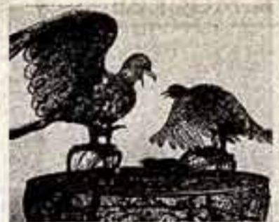
В Ереванском художественно-техническом училище № 8 юности и девушки овладевают секретами древних ремесел — ювелирного искусства и гравюры, обработки драгоценных и полудрагоценных камней, резьбы по дереву и кости, литейного дела, ковки качества и рукоделия.