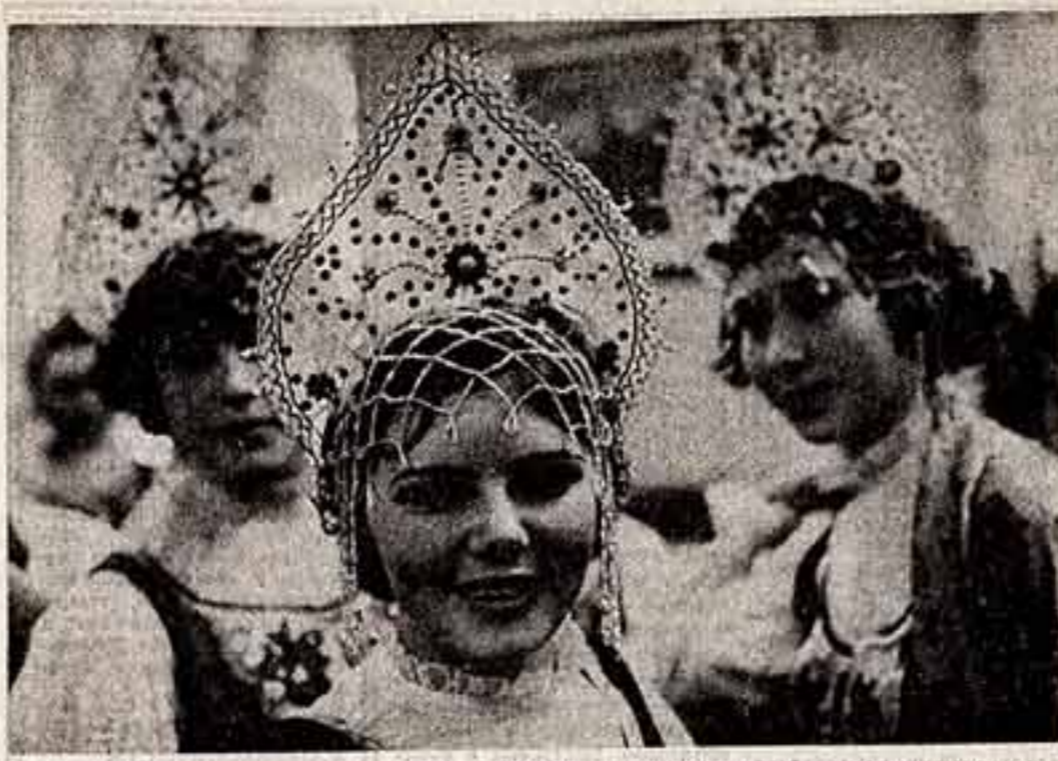
А. ПИЩИН. «Русский хор». (Хореографический коллектив Московского профессионального училища № 46).