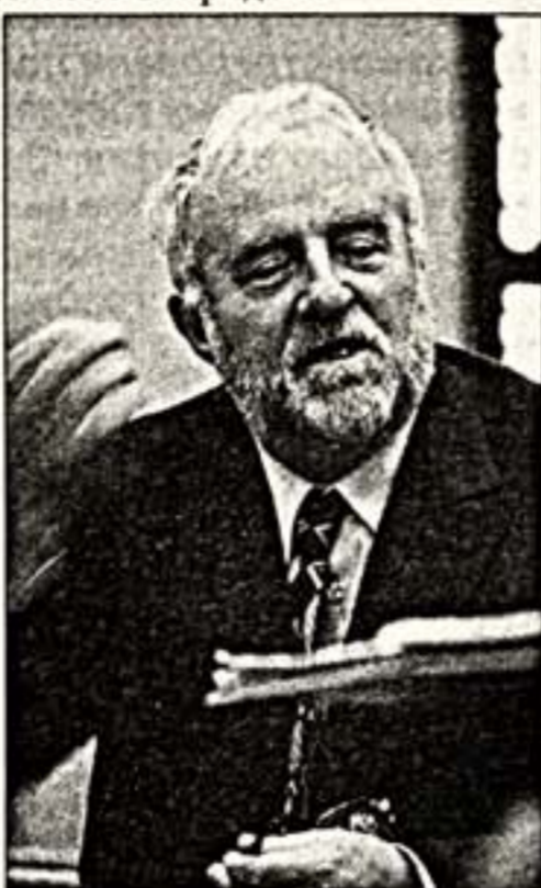
Вверху слева: Георгий Свиридов и Александр Ведерников. Авторский вечер композитора в Большом зале Ленинградской филармонии. 1975 г. Внизу слева: в своем кабинете за чтением псалма Давида. Концы 80-х годов. Внизу справа: в дни посещения родного города Фелюжа. У реки Уожки

Этот могучий духом человек казался (и должен был быть) бессмертным. Но год назад его не стало. Было большое горе. Провожали художника общенародной славы, восторженно своей почитной и близкой многим музыкой в доме. Им восхищались, его узнавали, как узнают любимых звезд. Нет Свиридова. Есть огромный мир его вдохновенной музыки. Она рождена сыном Земли, бесконечно ее любившим, и в первую очередь — Родину свою и свой народ.