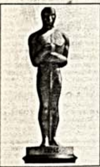
Главные претенденты названы

Фильмы на исторические темы стали главными претендентами на "Оскар" в нынешнем году.