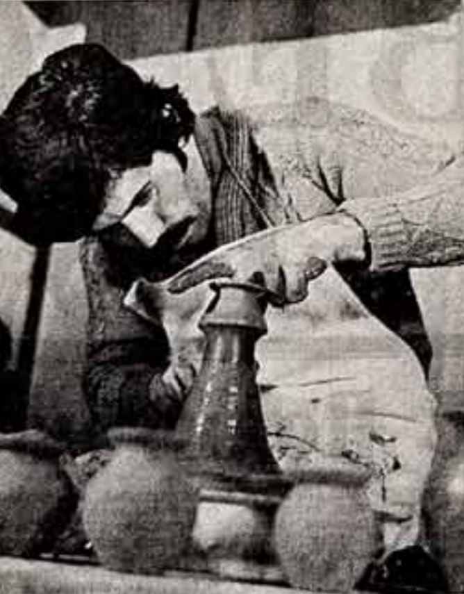
На ВДНХ СССР в Москве завершается смотр творчества учащихся самодеятельных мастеров нашей страны. Тысячи москвичей и гостей столицы смогли не только увидеть, но и непосредственно прикоснуться к чудесным миром народного творчества.

На их глазах народные умельцы Грузии создавали чеканные и прекрасные деревянные кубки, литовские мастера демонстрировали искусство плетения, а искусники из Молдавии исполняли народные мелодии на изготовленных ими инструментах.