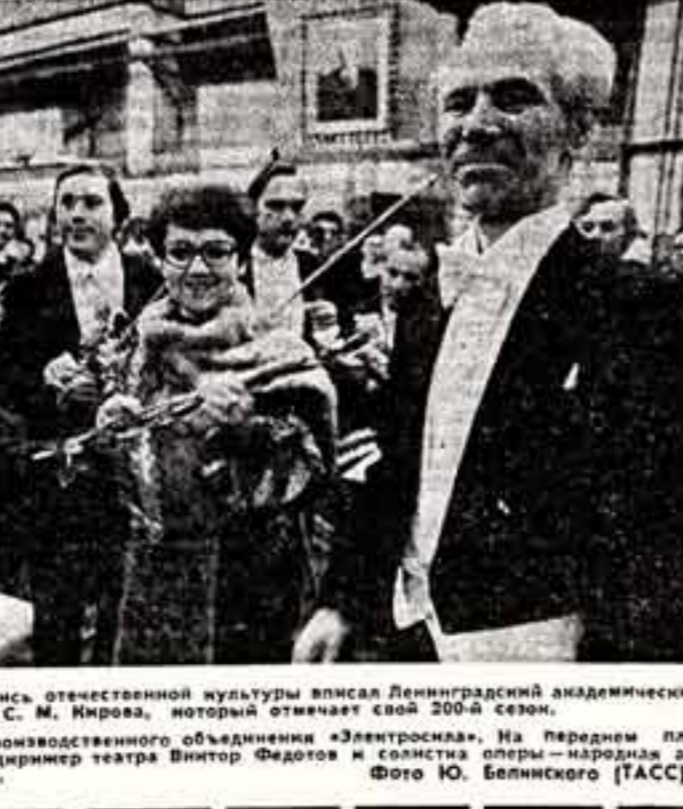
Архивные страницы в летопись отечественной культуры внесла Ленинградский академический театр оперы и балета имени С. М. Кирова, который отмечает свой 200-й сезон.