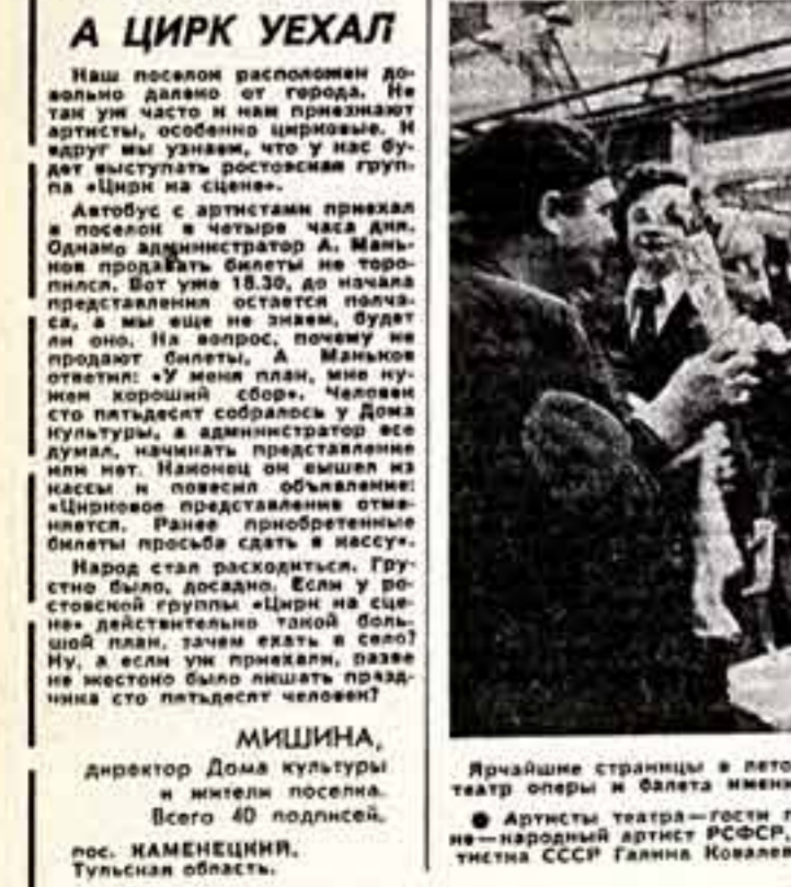
Архивные страницы в летопись отечественной культуры внесла Ленинградский академический театр оперы и балета имени С. М. Кирова, который отмечает свой 200-й сезон.

«Юность всегда объединяет, хотя я знаю, что не всем удается сохранить равновесие на жизненном пути. Однако у тех, кто прикоснулся к юности в театре более плотно, чем обычно, шансов на это равновесие, на мой взгляд, больше. Членам клуба «искусств» при Центральном доме работников искусств адресовал Виктор Розов свое обращение, записанное в летопись, которую ведет клуб все годы, сколько существует. А существует он двадцать пять лет.