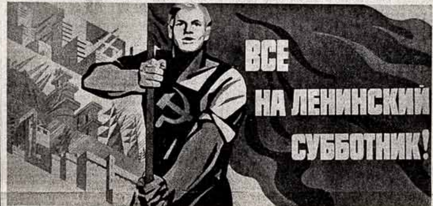
Праздничный плакат работы художника Вл. Кононова. (Издательство ЦК КПСС «Плакат»).