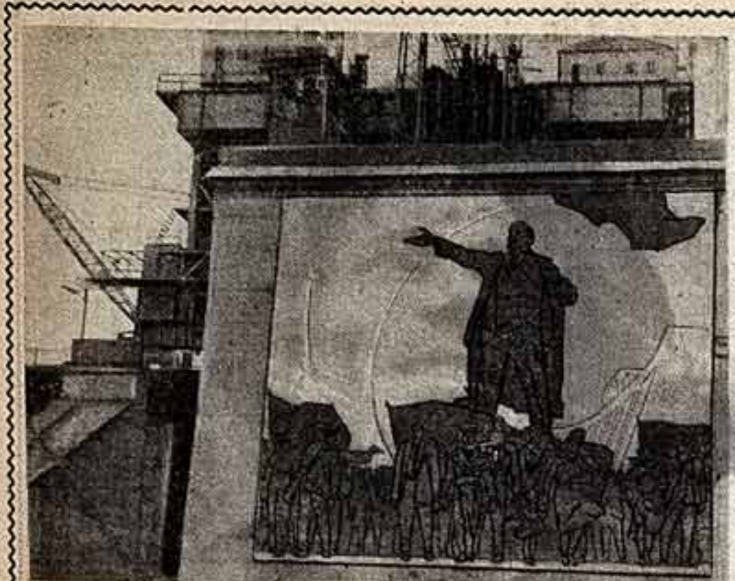
УЖЕ за три-четыре километра до Павловской гидроэлектростанции (Башкирия) можно увидеть грандиозное здание, выходящее на весь машинный зал ГЭС. Тема павлово — великий деловитый завет о электрификации всей страны. Размеры: высота 12 метров, длина 14 метров. Авторы — художники А. Павлов, А. Кудрявцев, К. Гергузов и В. Гавин.