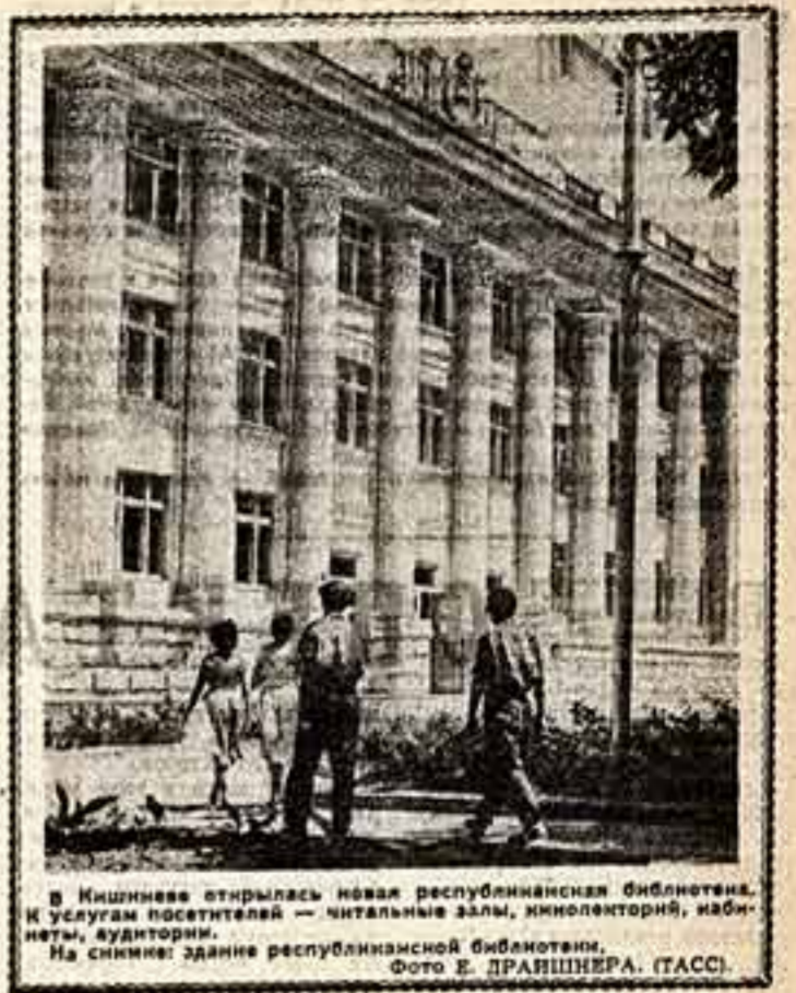
В Кинешине открылась новая республиканская библиотека. К услугам посетителей — читальные залы, кинозал, кабинеты, аудитория. На снимке: здание республиканской библиотеки.