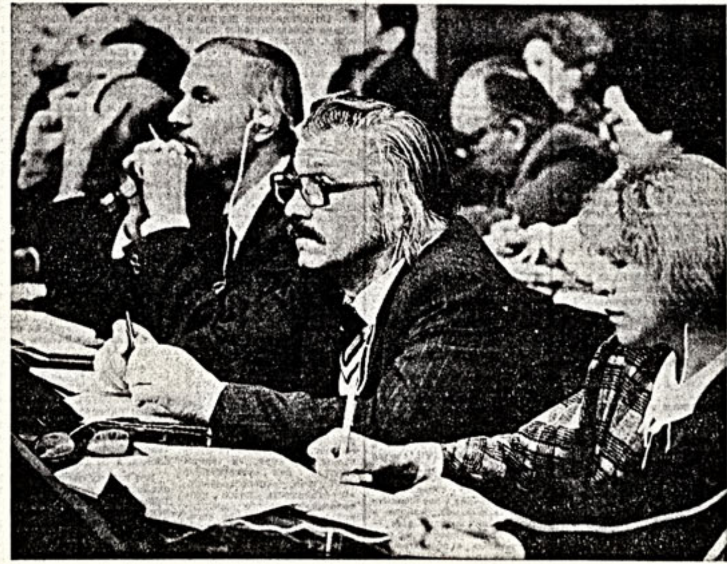
В зале заседаний.

Затем начались прения по докладу. 6 декабря съезд продолжает работу.