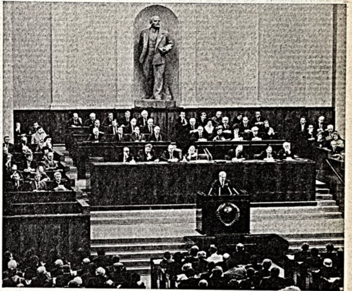
В Большом Кремлевском дворце.