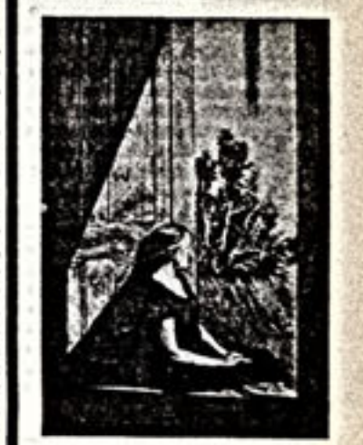
ЭДВАРД УАЙЕТ. «Валда от дома» (фрагмент).

Правда своей землей становится общечеловеческой, если за порог творчества остаются любые формы национализма, агрессивного и кичливое самоощущения, столь распространяемого в наши дни американским неоконсерватизмом. Монография объясняет, как рождается такая правда. И одновременно — почему и при сегодняшнем засилье в культуре Западного рода «авангардистских» модных направлений, принципиально пришедших реализма, стал для международного зрителя одним из самых притягательных символов американской культуры.