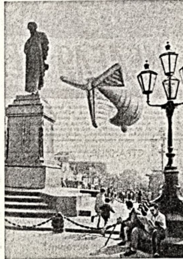
А все же, когда непогода Забыть не дает о войне, Зима сорок первого года, Как совесть, заходит ко мне.

Пятьсот тысяч рублей собрано комсомольцами и пионерами на строительство самолета «Юный истребитель».