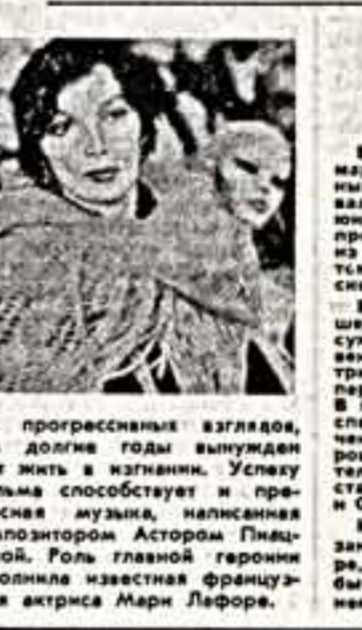
Кадр из фильма «Эксперимент Эвас».