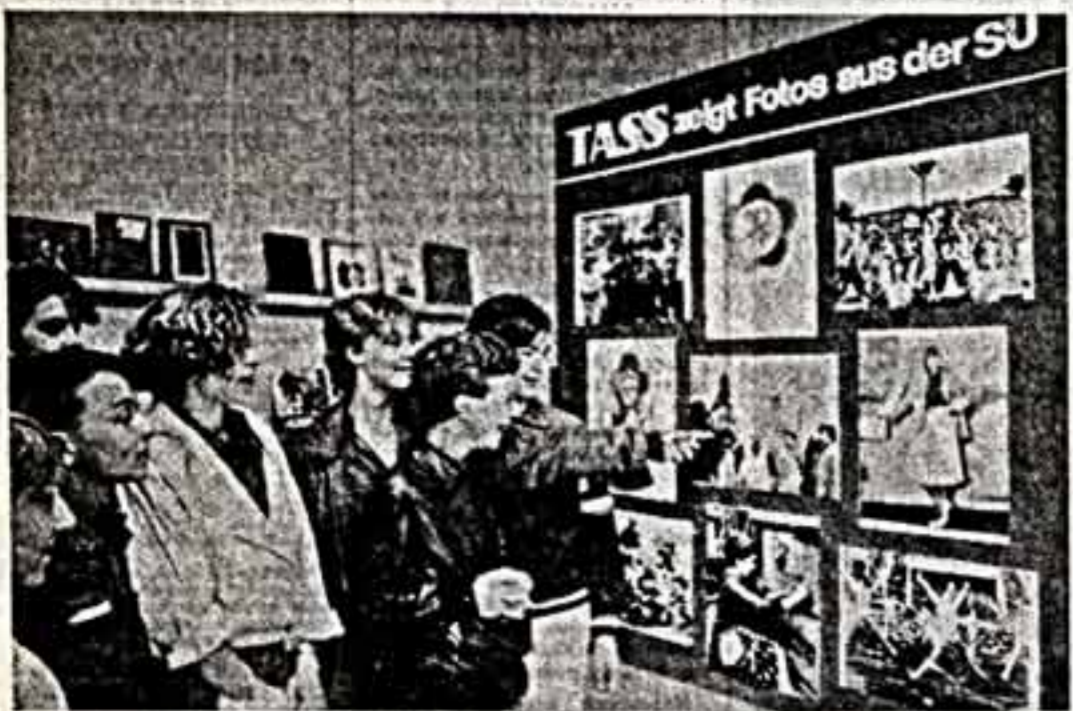
Всегда внимательно в Доме советской науки и культуры в Берлине. Школами перед фотографией, рассказывающей о XII Всемирном фестивале молодежи и студентов в Москве.