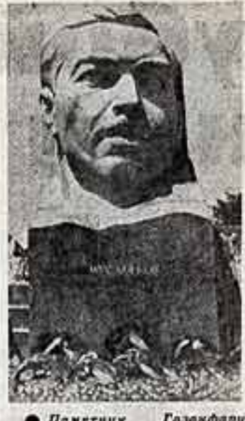
Памятник Газафару Мусабоеву, видному партийному и государственному деятелю Азербайджана, открыт на одной из площадей Баку...