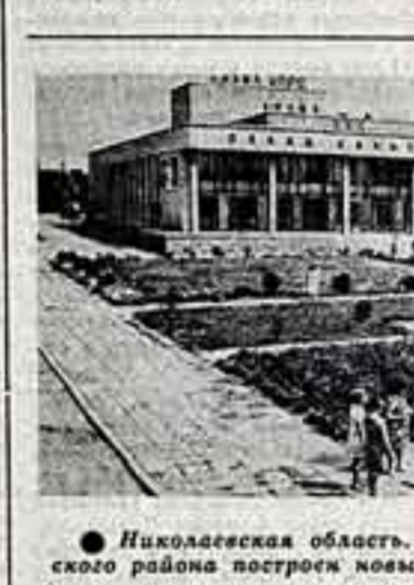
Николаевская область. В колхозе «Украина» Очаковского района построен новый Дом культуры.