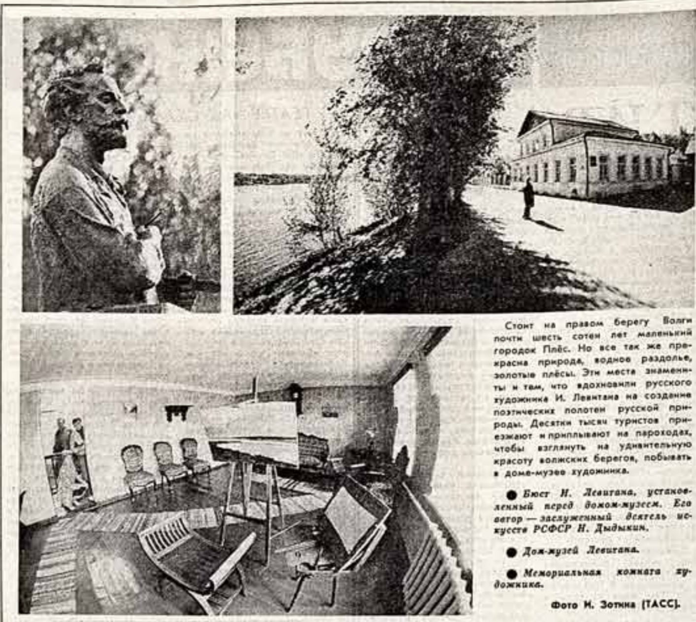
Стоит на правом берегу Волги почти шесть сотен лет маленький городок Швец. Но все же прекрасная природа, водное раздолье, золотые пляжи. Эти места знамениты и тем, что являлись русскому художнику И. Левитану в создании поэтических полотен русской природы. Десятки тысяч туристов приезжают и приплывают на пароходах, чтобы взглянуть на удивительную красоту волжских берегов, побывать в доме-музее художника.